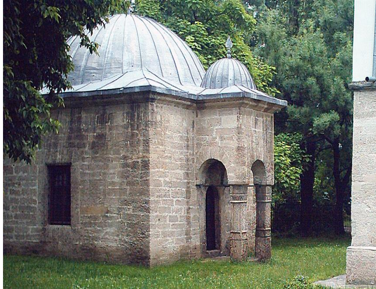
Resim 3. Pazvantoğlu Kütüphanesi - Vidin 6

Kütüphane kitabesinden, Pazvantoğlu'nun bu kütüphaneyi babasının anısına yaptırdığı “Vâlid-i muhteremi rûhuna idüb i'mâl” ifadesinden anlaşılmaktadır. Kütüphaneye ait olan kitapların üzerinde bulunan mühürlerden, kütüphanenin Osman Pazvantoğlu ve ailesi tarafından bağışlanan kitapların dışında başka kişiler tarafından bağışlanan pek çok kitaptan teşekkür ettiği anlaşılmaktadır (BOA, HR.İD. 1371/6/1; Stajnova, 1979, s. 58; Kenderova, 2008, s. 19-24). Pazvantoğlu'nun vefatından sonra, 1807-1810 yılları arasında Vidin'in yöneticiliğini yapan İdris Paşa'nın da kütüphaneye oldukça önem verdiği anlaşılmaktadır. İdris Paşa'nın yöneticiliği döneminde kütüphane dermesi büyük gelişim göstermiştir. Paşa bizzat kendisi de kütüphaneye birçok kitap bağışlamıştır. Gerek Sofya'da, gerek İstanbul'da bulunan Pazvantoğlu Kütüphanesine ait kitaplar arasında, İdris Paşa mührünü taşıyan çok sayıda kitap bulunmaktadır (Stajnova, 1979, s. 62; Sabev, 2017, s. 262).