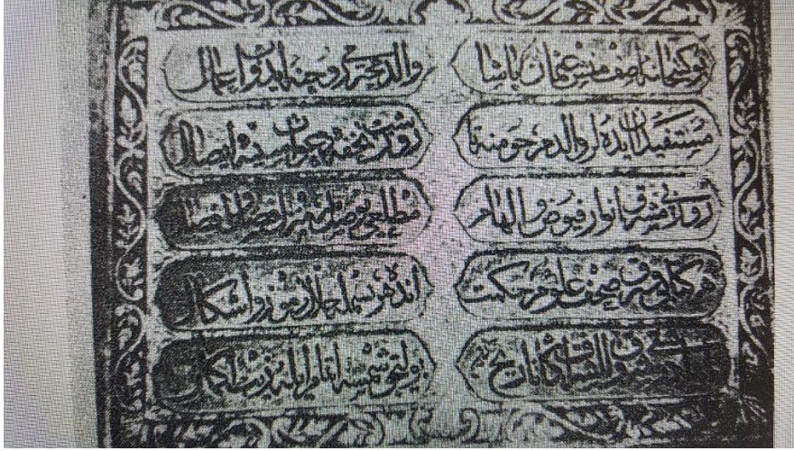
Resim 2. Pazvantoğlu Kütüphanesi'nin Giriş Kapısında Yer Alan Kitabe (Stajnova, 1979, s. 63).

Kütüphane kitabesinden, Pazvantoğlu'nun bu kütüphaneyi babasının anısına yaptırdığı “Vâlid-i muhteremi rûhuna idüb i'mâl” ifadesinden anlaşılmaktadır. Kütüphaneye ait olan kitapların üzerinde bulunan mühürlerden, kütüphanenin Osman Pazvantoğlu ve ailesi tarafından bağışlanan kitapların dışında başka kişiler tarafından bağışlanan pek çok kitaptan teşekkür ettiği anlaşılmaktadır (BOA, HR.İD. 1371/6/1; Stajnova, 1979, s. 58; Kenderova, 2008, s. 19-24). Pazvantoğlu'nun vefatından sonra, 1807-1810 yılları arasında Vidin'in yöneticiliğini yapan İdris Paşa'nın da kütüphaneye oldukça önem verdiği anlaşılmaktadır. İdris Paşa'nın yöneticiliği döneminde kütüphane dermesi büyük gelişim göstermiştir. Paşa bizzat kendisi de kütüphaneye birçok kitap bağışlamıştır. Gerek Sofya'da, gerek İstanbul'da bulunan Pazvantoğlu Kütüphanesine ait kitaplar arasında, İdris Paşa mührünü taşıyan çok sayıda kitap bulunmaktadır (Stajnova, 1979, s. 62; Sabev, 2017, s. 262).