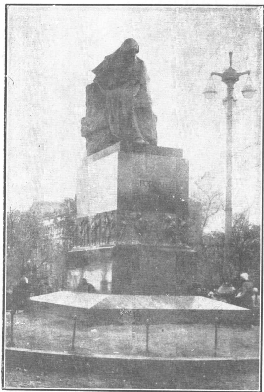
果戈理紀念石像 在莫斯科果戈理花園內