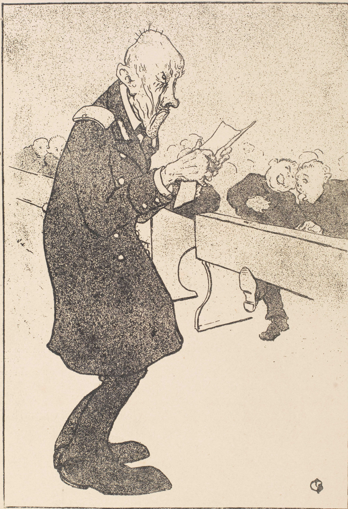
— Дѣлалъ я изъ нихъ грековъ, дѣлалъ римлянъ, что только не дѣлалъ, а какъ теперь русскими сдѣлать и не соображу!?