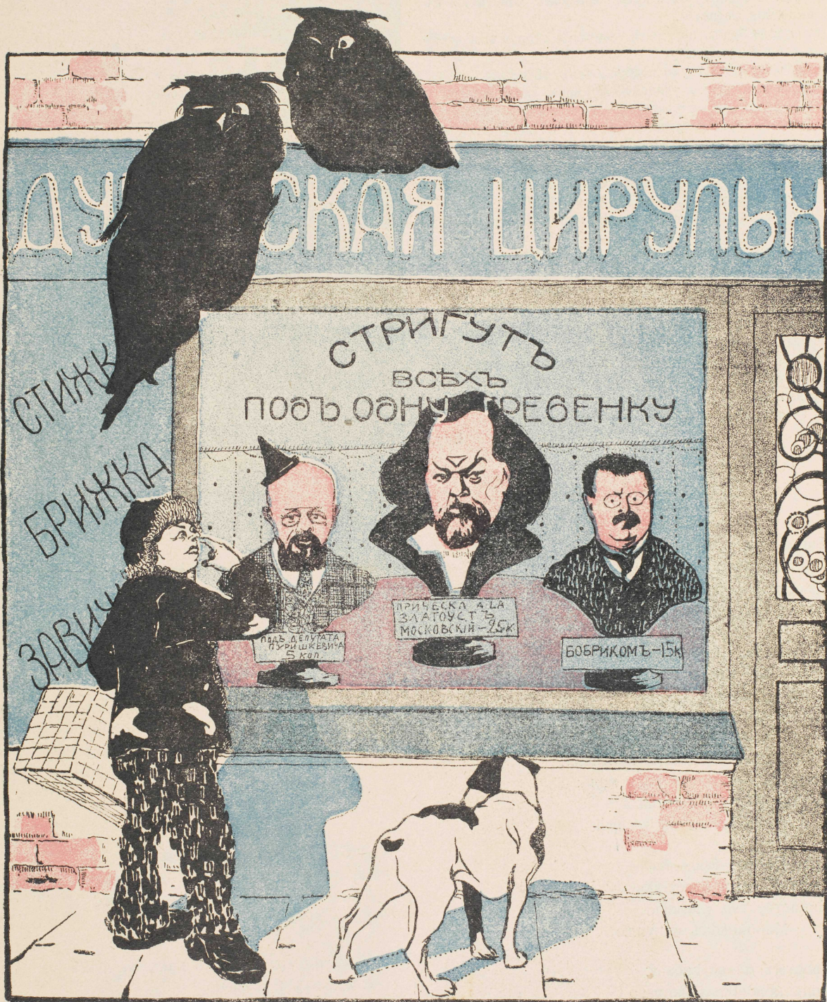
Единственный результат думской работы.