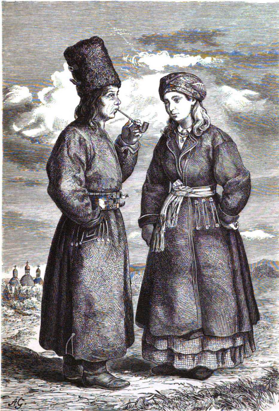
Русскіе крестьяне Золочевского уѣзда села Стрептова въ восточной Галичинѣ.