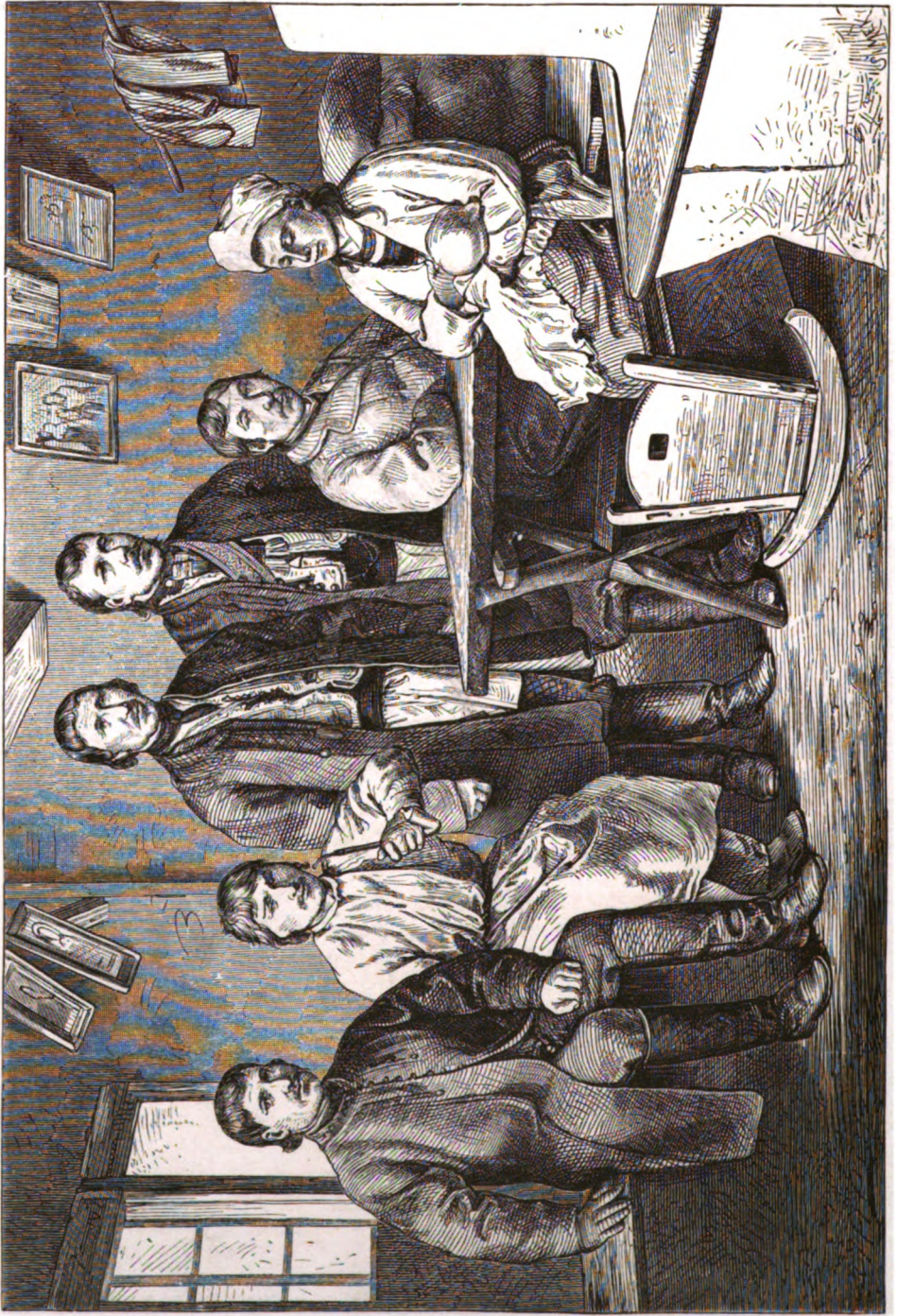
Типы Галичанъ: Подольянинъ, Коломыйецъ, Хуцулъ и Перемышлянинъ въ крестьянской избѣ въ окрестности Львова.