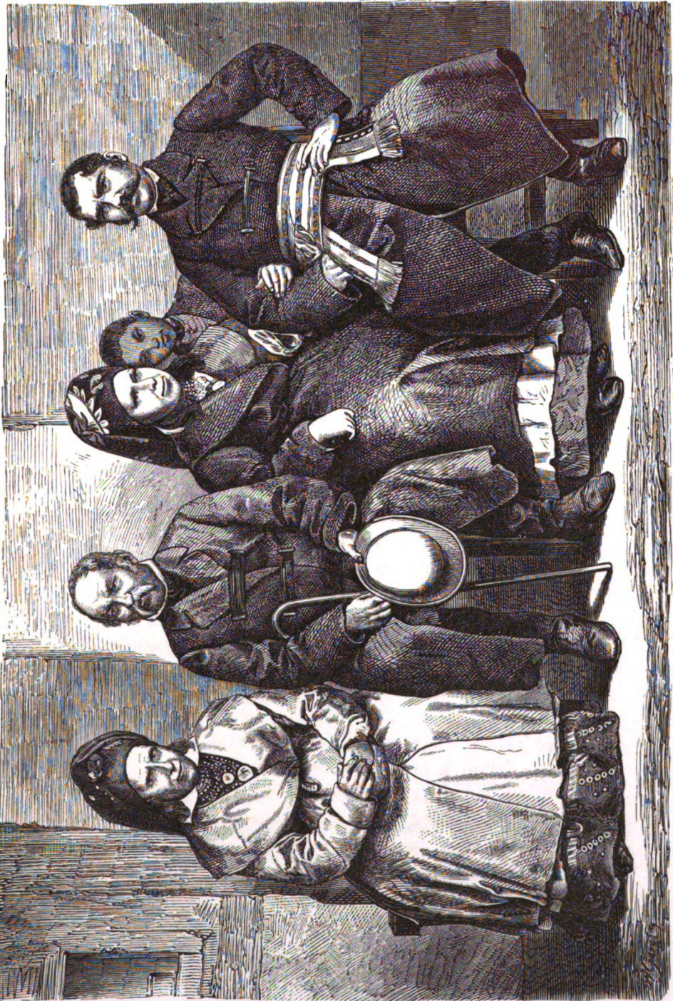
Русские мѣщане Станиславскаго уѣзда города Бучача въ восточной Галичинѣ.