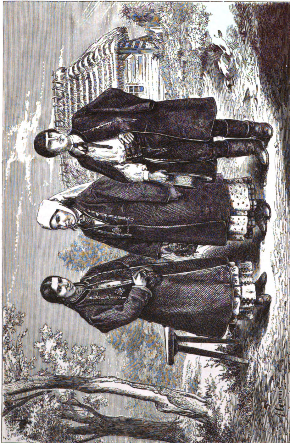
Рускіе крестьяне Станиславскаго уѣзда села Нагорянки въ восточной Галичинѣ.