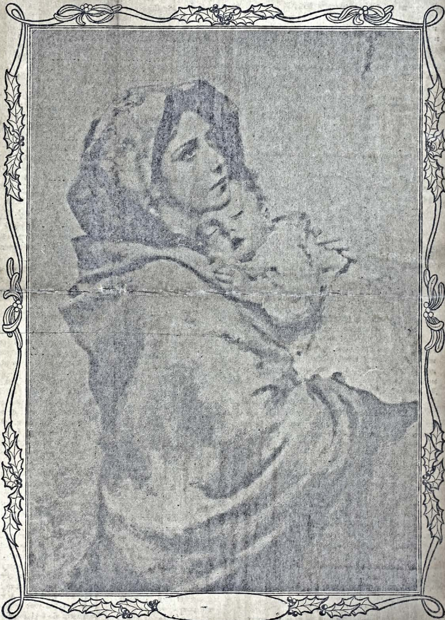
Марія з Дитятем.