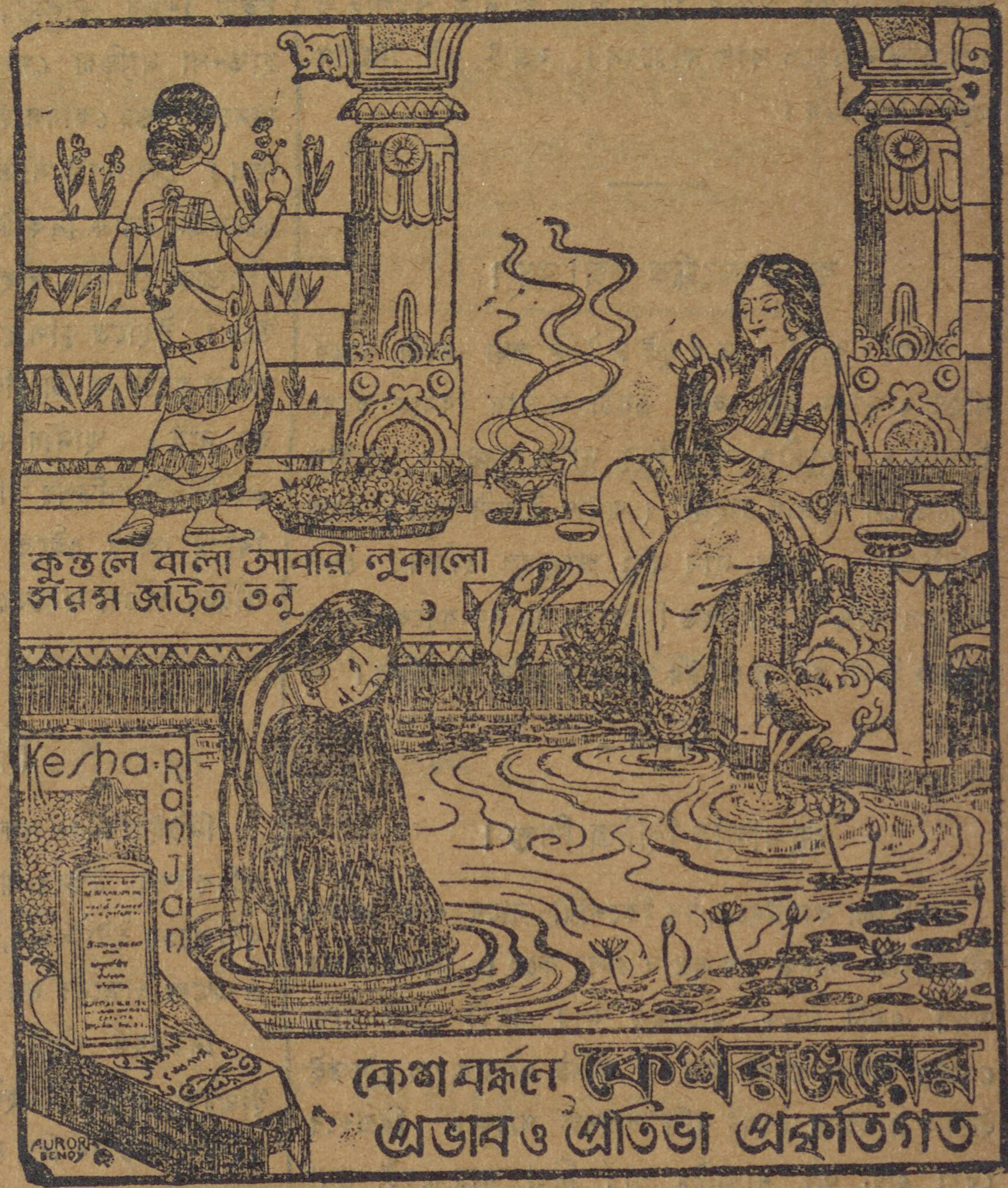
কুন্তলে বালা সোবরি লুকালো সর্বস্ব জড়িত তনু

কেশরকলে কেশরসুন্দরের প্রভাব ও প্রতিভা প্রকটিত