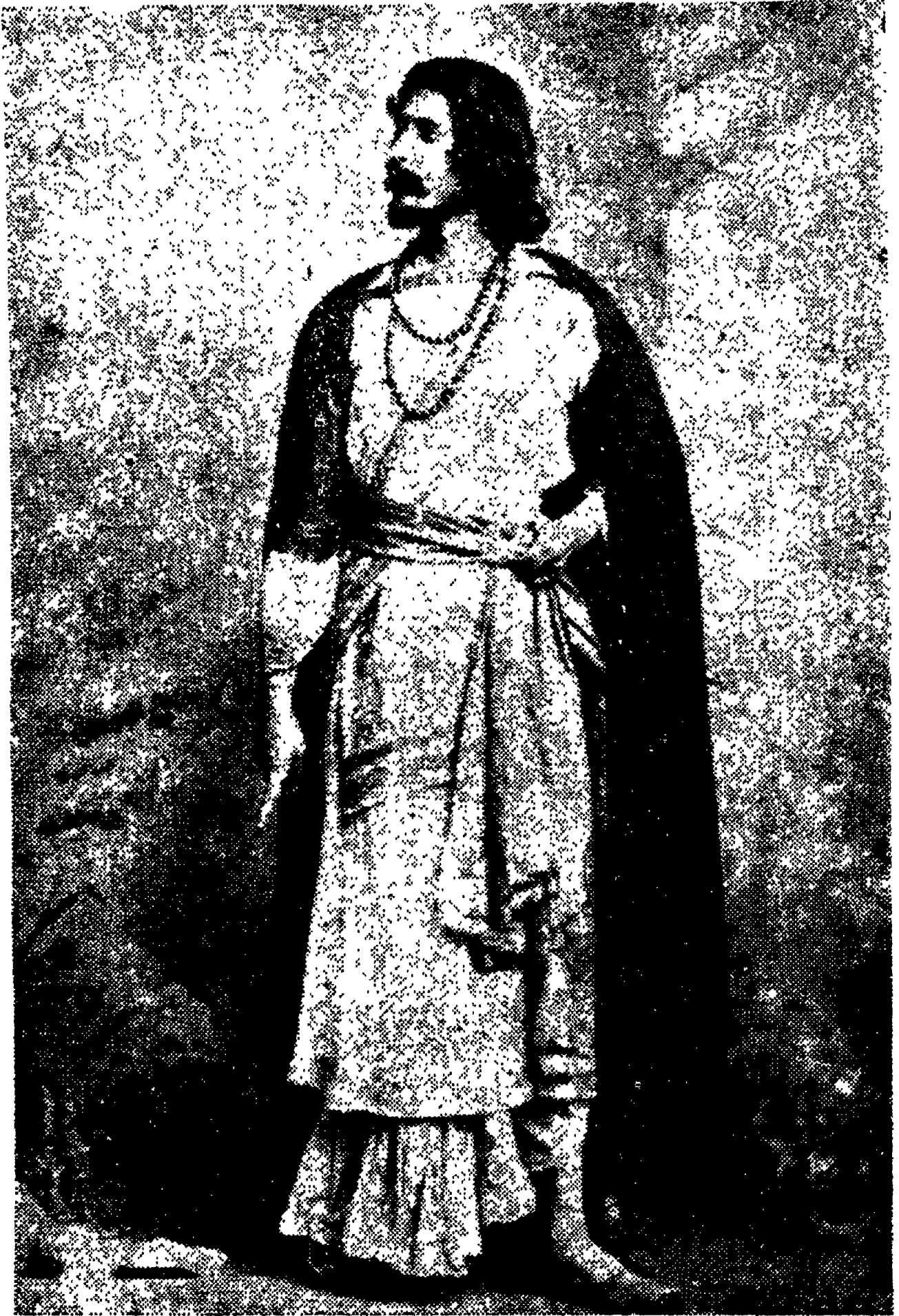
'వాలీకి' పాత్రధారి గురుదేవులు శ్రీ రవీంద్రనాథ్ ఠాకుర్