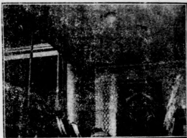
正在佈置中的靈堂