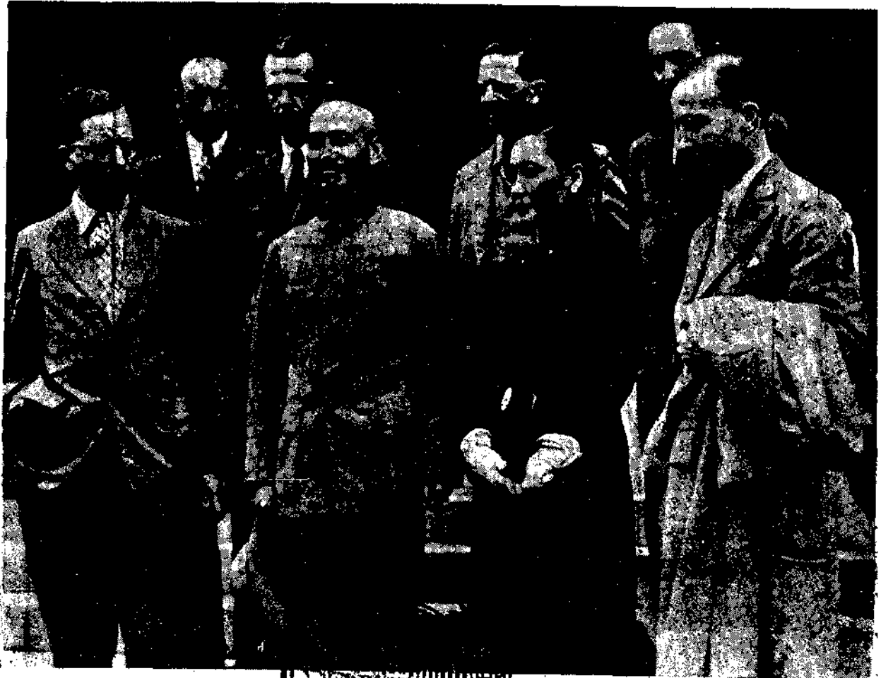
蔣委員長於慰勞社長張國燾記者合影