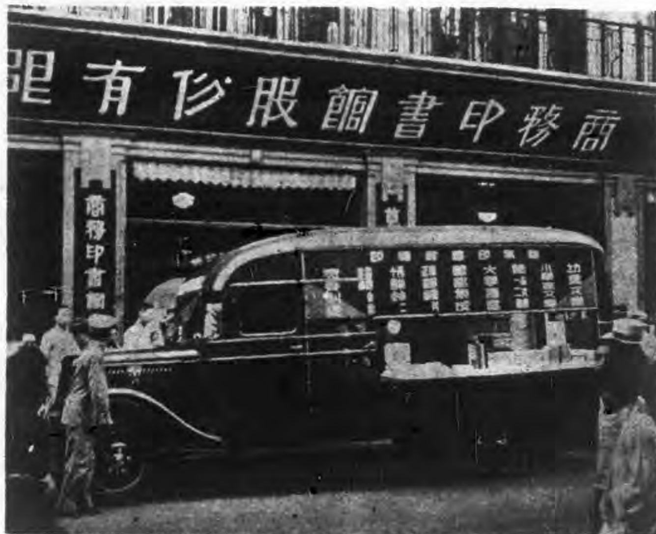
本館巡迴展覽汽車之外觀

出版與國勢 叢書集成答客問(上) 法贈東方圖書贈受典禮記要 怎樣招待顧客 理想的管理 使顧客輾轉介紹之方法 小職員所寫之一頁 讀物推薦——經濟學基本原理和經濟科學概論