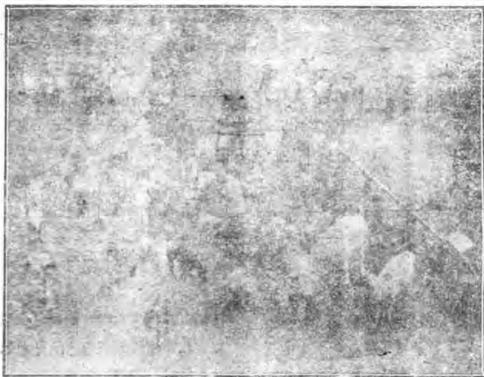
這是 德國柏林 的兒童動物園。園裏的動物都很幼小，兒童最喜歡和它們親近。

圖書館，陳列的書籍多是 萬有文庫 經史子集，一點也不懂。兒童想研究科學，沒有兒童科學館。像這種情形，兒童生在 中國 ，真是再苦沒有了。