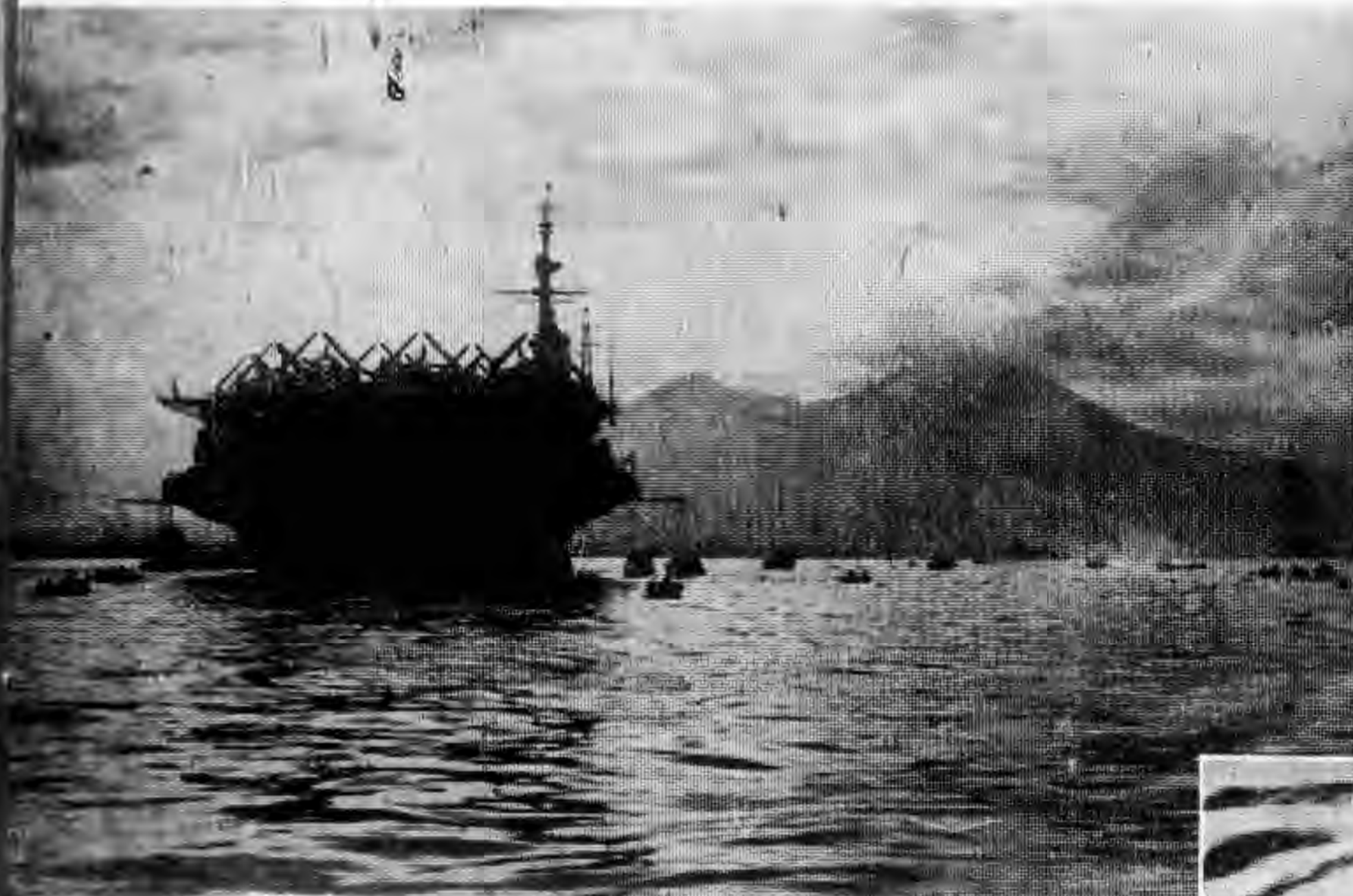
受航美的港爾泊拉國意在泊停，日八廿月八是這 機學受入駛母空軍這在現。就「福斯羅」艦母 了問訪普親作去