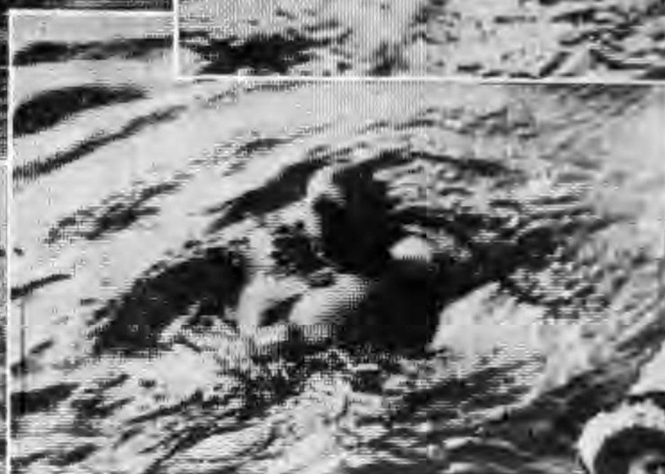
四東孩 一千方千隊 道個多和，伍日 本這，萬南他中本這 回他日洋是散一略 日將人各處個 被中島虛的在