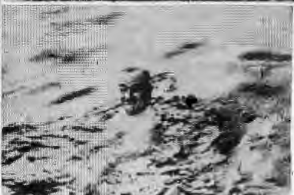
杜魯門大總統在伯羅達休假期時，觀察游泳，這 是他在海甲 的四個頭 ，看起來， 他似乎很愛 游泳式。