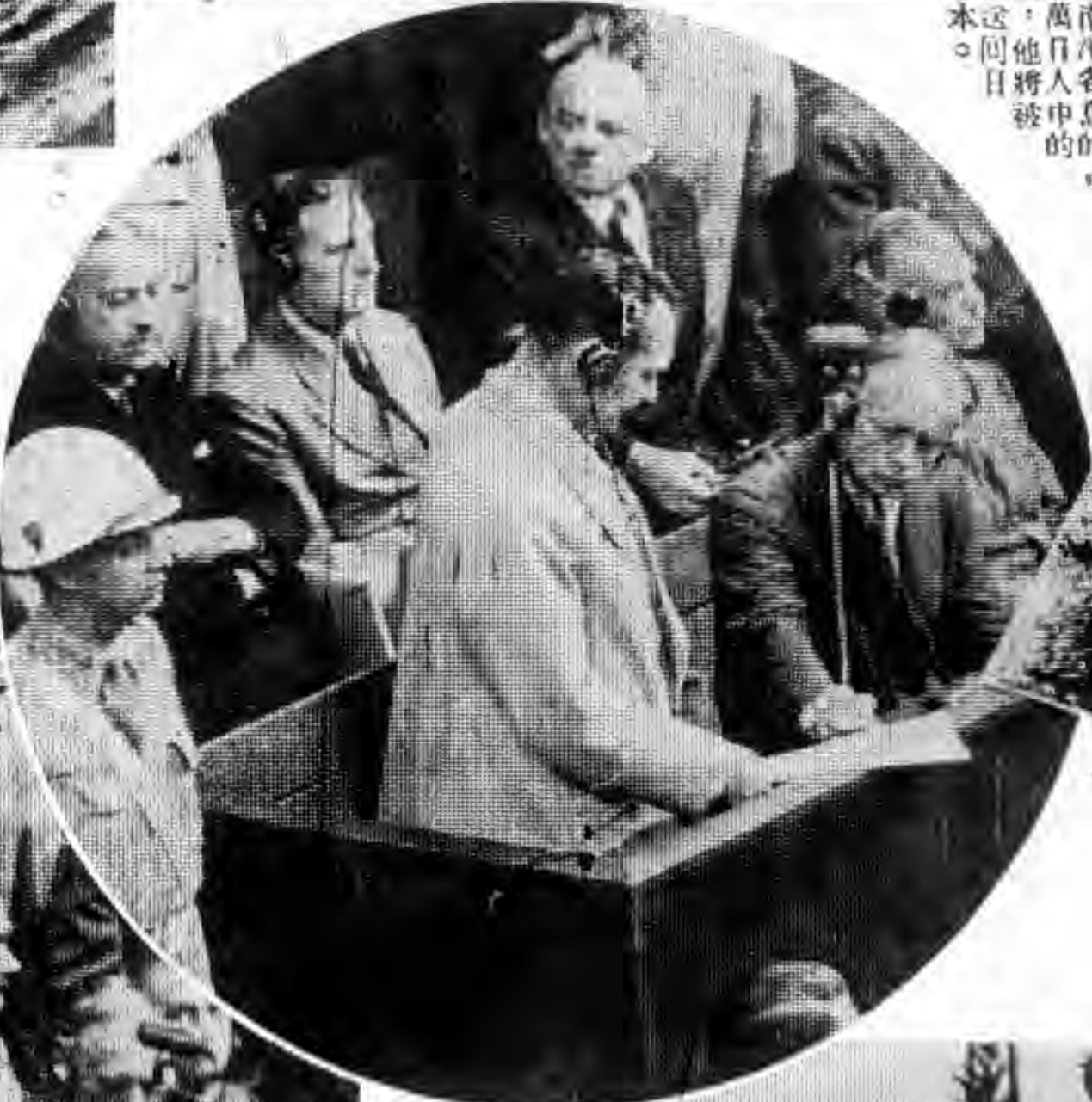
兒特納班這在現，東結訊審案犯卸特納堡倫紐 圖下，定決的運命們他着候靜中監在都，們手 ，林戈是的圖有。群聲的後最他作在正斯精為 特納是，的着坐林戈份，扎押的後最着作在也 氏甫洛特本李長外的攝政