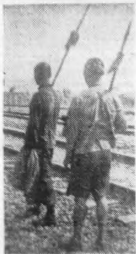
津浦沿線愛護村民的雄姿