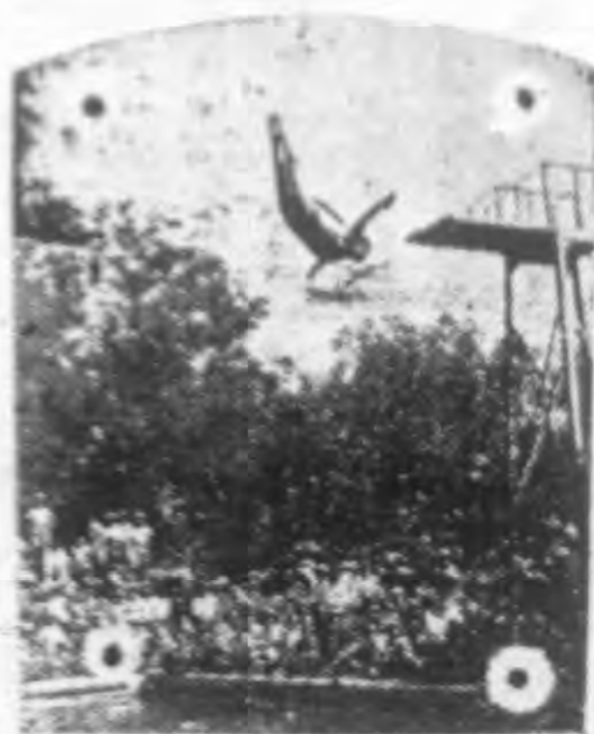
→ 北京中南海舉行模範游泳表演大會(圖為跳板表演情形)