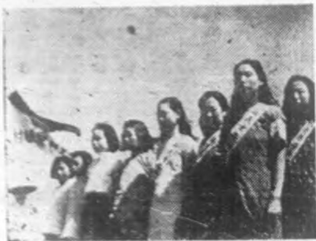
↑ 隊女婦路愛之頭陣亞與於立