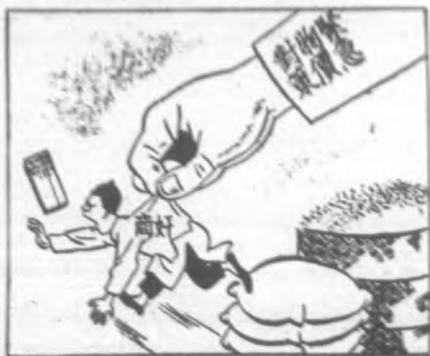
取緝奸商採嚴厲措施