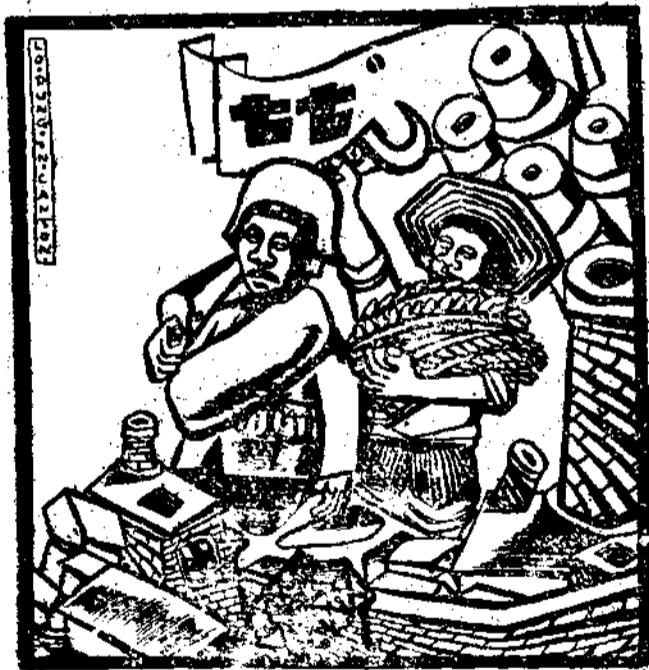
日念紀榮光的國建戰抗是「七七」