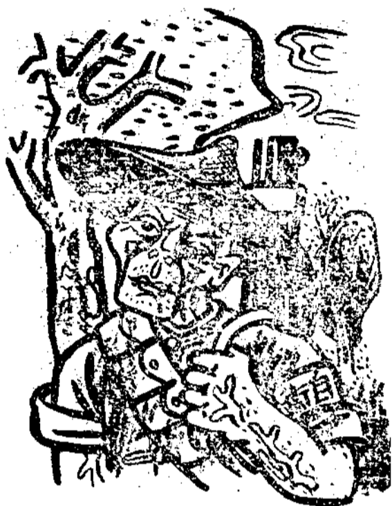
• 作烏幻黃 •