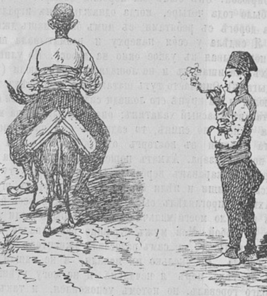
Типы Габровскихъ жителей.

лень, особенно на главной улицѣ, представляющей изъ себя