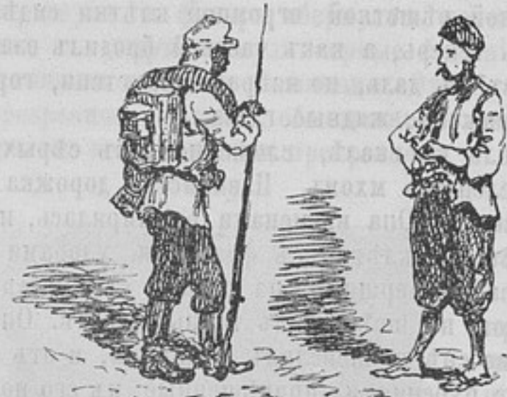
Русскій солдатъ и болгаринъ въ Габровѣ.

ную съемку нашихъ и турецкихъ укрѣпленій. Время было жаркое, зной давалъ себя чувствовать повсюду, и на улицѣ