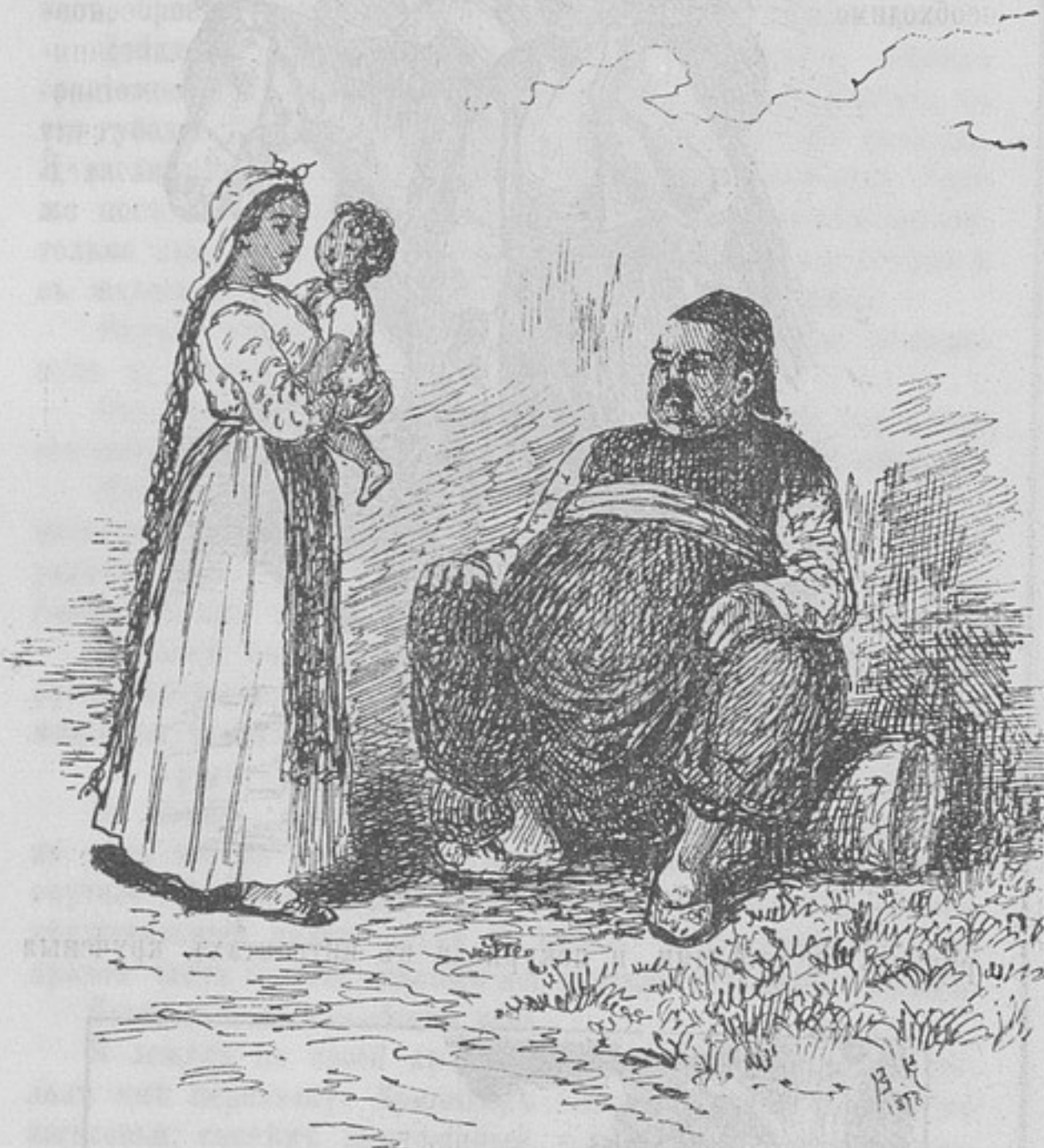
Типы Габровскихъ жителей.

Воздухъ отравляется ѣдкимъ запахомъ горѣлаго сала, падающаго отъ сосисекъ, которыхъ жарятъ на рѣшеткахъ надъ углями. Въ воздухѣ стоялъ шумъ и гамъ отъ говора, рѣзкихъ звуковъ, издаваемыхъ деревянными туфлями, на кото-