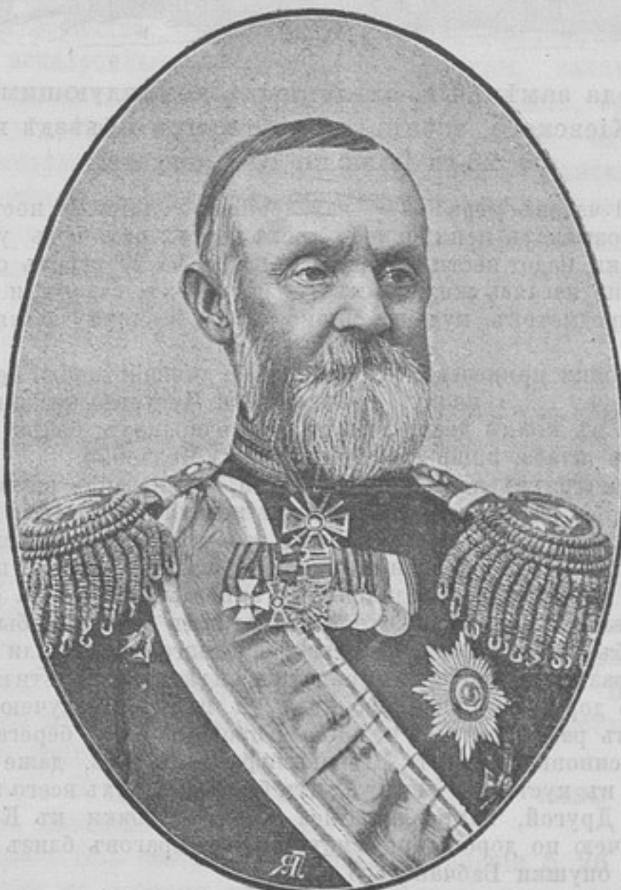
Командиръ 9-й артиллерійской бригады, Генераль-Маіоръ Александръ Эммануиловичъ БУДДЕ.

Родился въ 1836 г. Воспитывался въ 1-мъ Московскомъ ка-