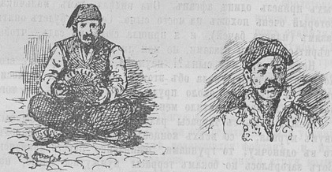
Типы Габровскихъ жителей.

нѣчто въ родѣ пассажа, такъ какъ крыши домовъ съ обѣихъ