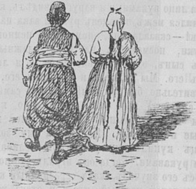
Типы Габровскихъ жителей.

и въ домахъ; городъ, несмотря на это, былъ очень ожив-