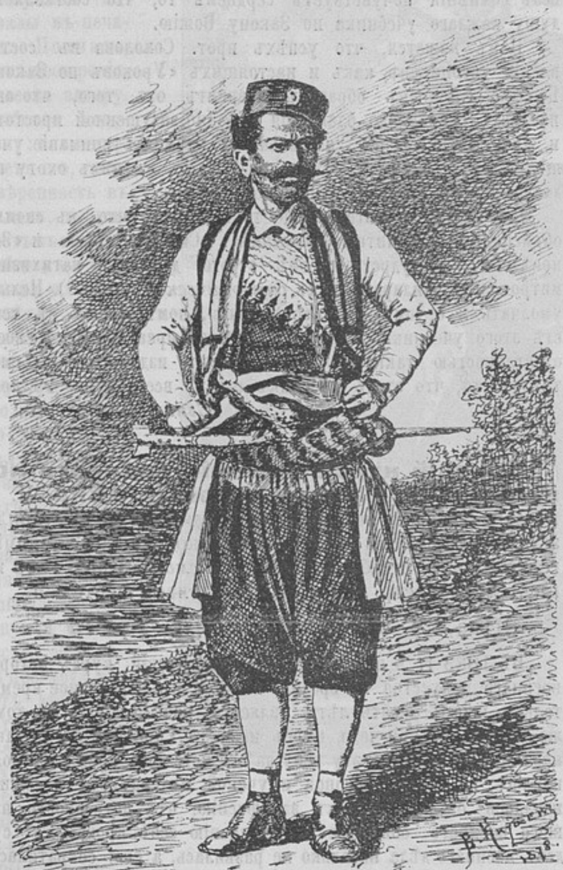
Типы иноземцевъ на улицахъ г. Габрово.

! На улицѣ толкалась разношерстная толпа изъ мѣстныхъ жителей, разныхъ пришлецовъ, иногда въ очень живописныхъ костюмахъ, нашихъ солдатъ въ кепи съ затыльниками и бѣлыхъ рубахахъ, и небольшого числа нашихъ погонцевъ, возвращавшихся въ Россію со своими повозками изъ за Балканъ