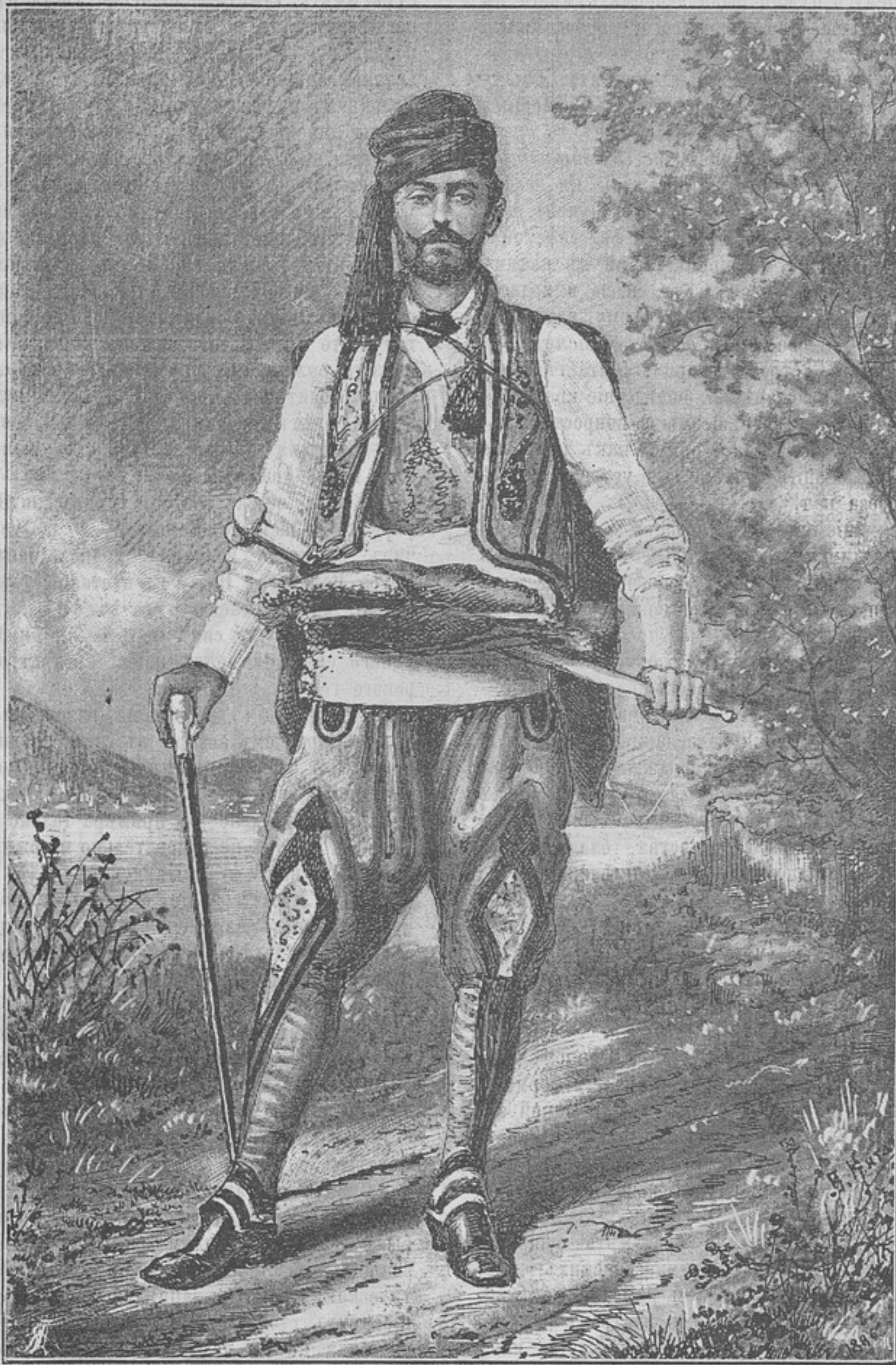
Типы иноземцевъ на улицахъ г. Габрово.