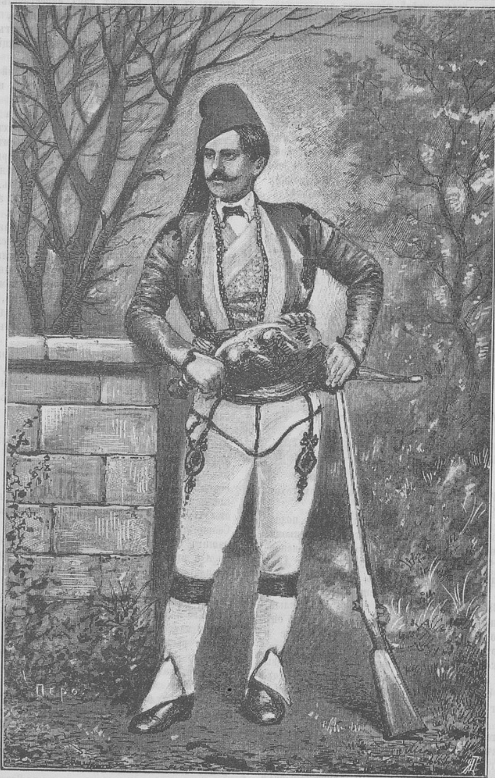
Типы иноземцевъ на улицахъ г. Габрово.

Заложивъ рога на спину, промчался мимо насъ ручной