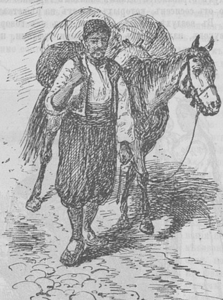
Типы Габровскихъ жителей.

Грязные, до пояса голые братушки мѣсятъ, вертятъ или тянутъ тѣсто и сладкую массу для рахатъ-лукума, перегова-