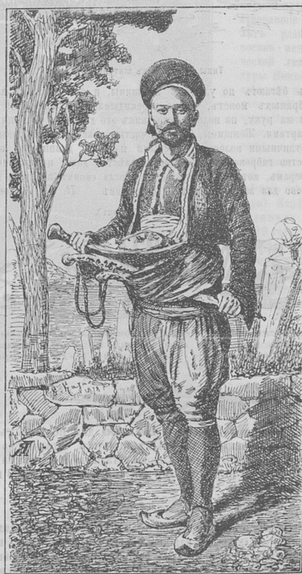
Типы иноземцевъ на улицахъ г. Габрово.

риваясь съ сосѣдями и покуривая въ антрактахъ крученія