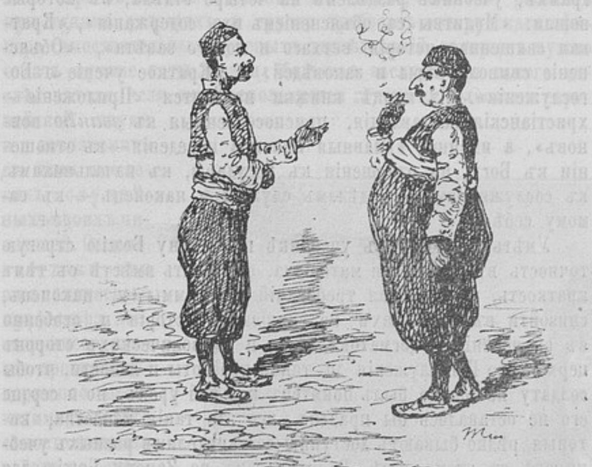
Типы Габровскихъ жителей.

обыкновенно на 1 или на 1½ аршина выступают надъ ниже лежащимъ. Виды домовъ, вслѣдствіе этого, принимаютъ курьезный видъ, особенно если домъ стоитъ особнякомъ.