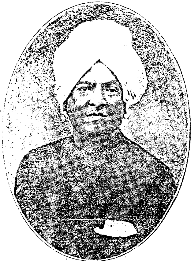
பண்டிதர் உ. அயோத்திதாசர் 1845 - 1914)