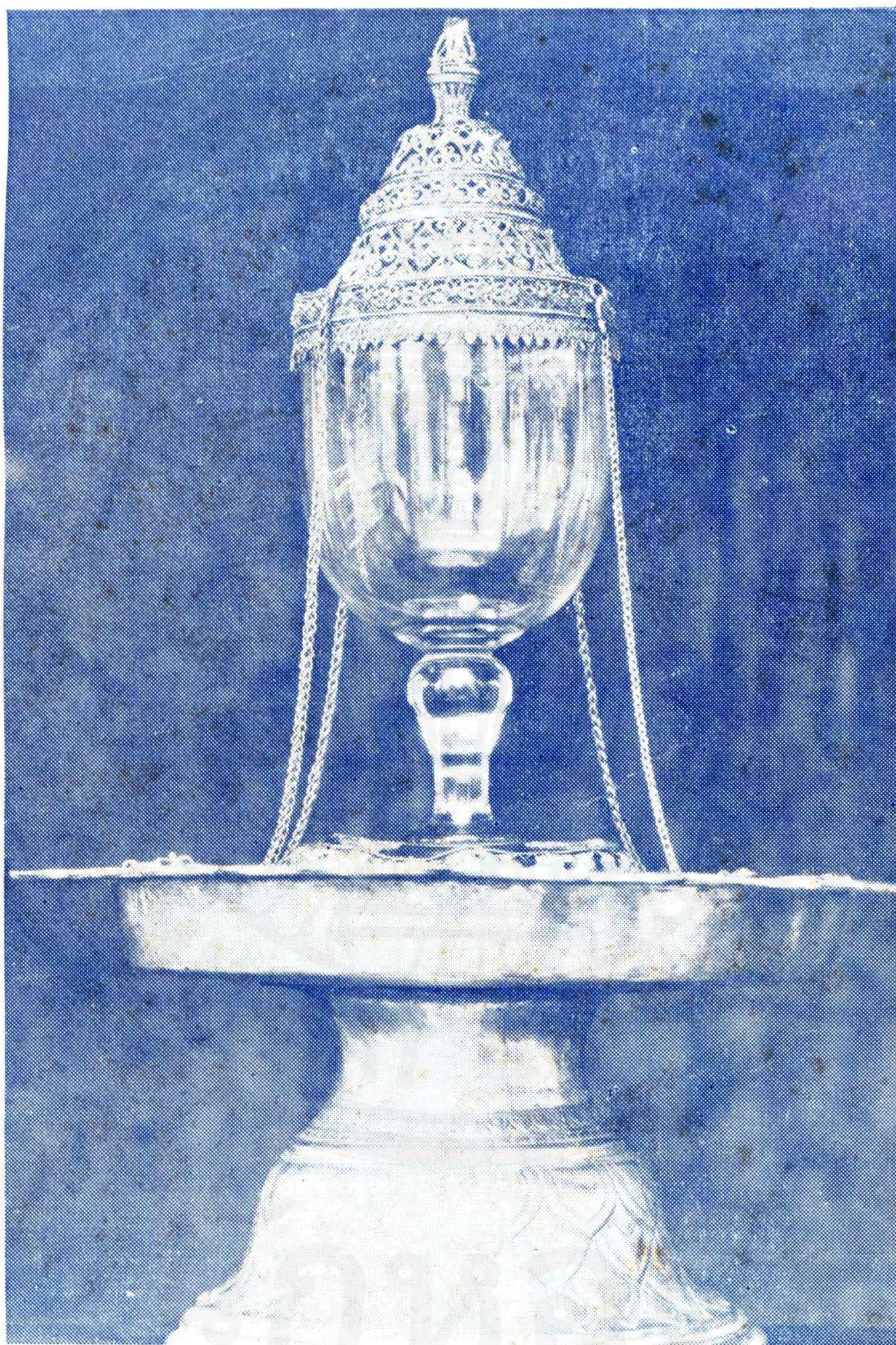
พระบรมธาตุจอมทอง