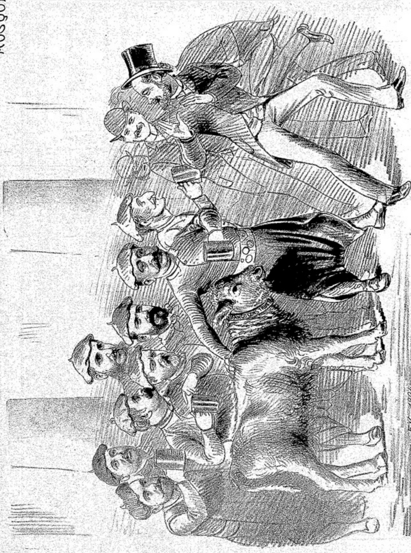
EN 1884 DIRECTORIO DEL BANCO CONSTRUCTOR — Señores marchantes, ¿pueden se suscribir a la fábrica de este támara? BOLSISTAS — ¡Ja, ja, ja, ja! ¡Si esta fábrica no sirve, ¿que le hite ni que diables! ¡vendámosla a su cabueta, no queramos indigestarnos!