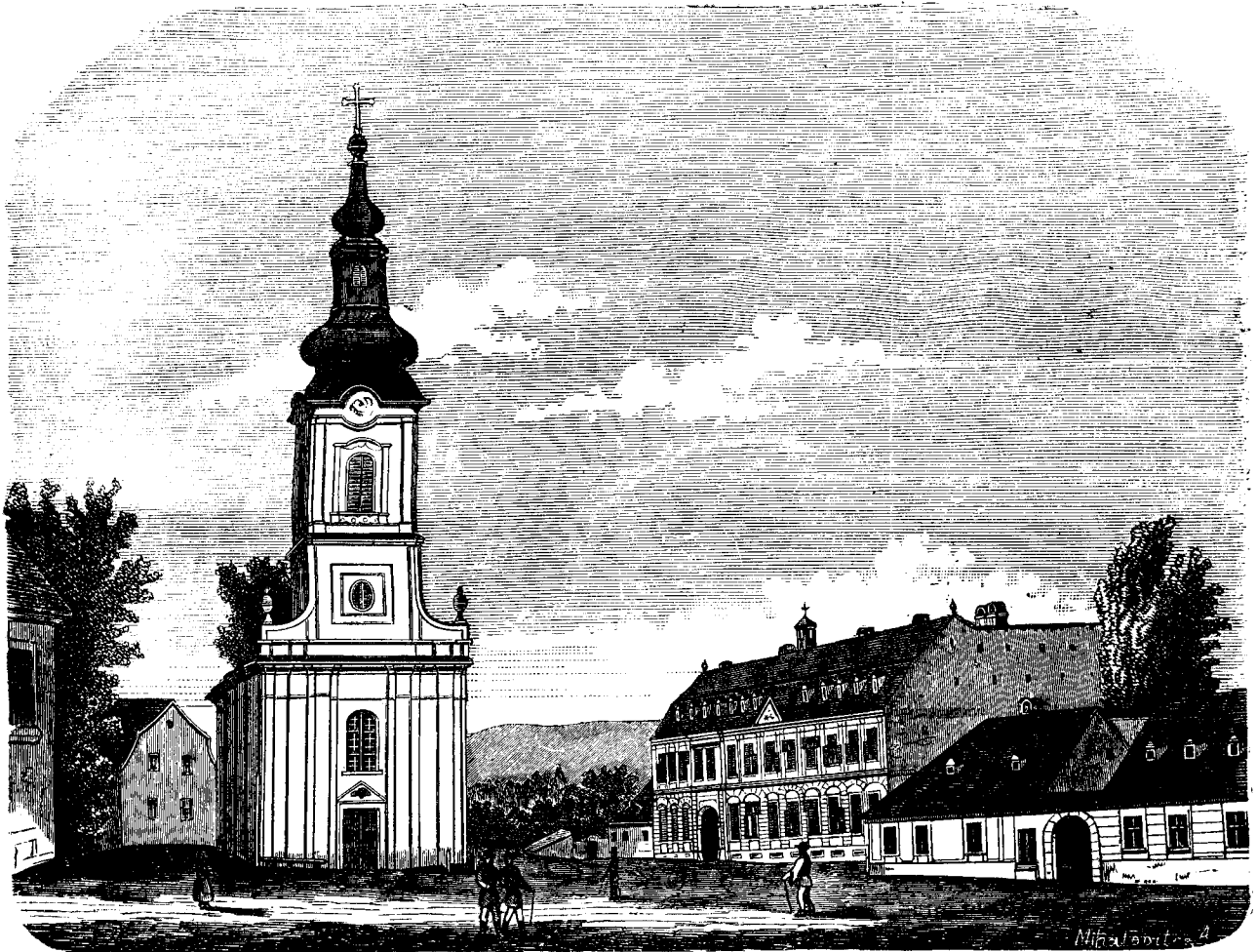
Gimnasiulu romanu din Beiusiu.

„In acea di mare . . . Di de cununare“ . . . — Óre ce-ai juratu ?“