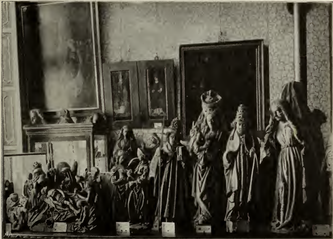
BISSCHOPPELIJK MUSEUM TE HAARLEM. BEELDENKAMER.

De lezer vindt op de tweede plaat (bl. 5) de afbeelding van dit portret, gelijk het hangt in het voorportaal des museums, als wil het de bezoekers welkom heeten, en ook zelf het eerst beschouwd worden. Onder het portret is als chronogram het opschrift aangebracht: