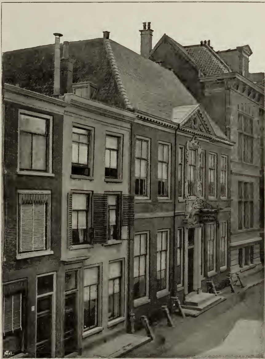
HET BISSCHOPPELIJK MUSEUM TE HAARLEM.

vierkant of op zijn hoogst, als het deftig zal wezen, bochtig en gedraaid naar de slechtste modellen van rococostijl; het lijstwerk ook al