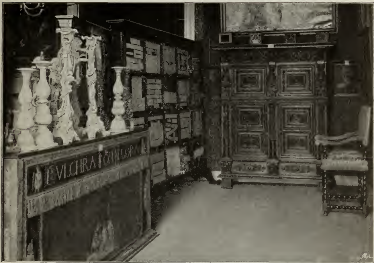
BISSCHOPPELIJK MUSEUM TE HAARLEM. ZAAL MET VOORWERPEN VAN DE 17 e EN 18 e EEUW.

in de 17e en 18e eeuwen te veel moesten schuilhouden, weinig Roomsche voorstellingen aangetroffen; maar dit heeft niet belet, dat er uit een zevental tafelborden, die de katholieke Sacramenten te zien gaven, nog twee blijven getuigen: „Het Furmsel 2,” en „Het Huwelijk 7”. — Dat er bij onze handelsbetrekkingen met Japan in de 17e eeuw, ook wel katholieke religieuze voorwerpen derwaarts zijn uitgevoerd, werd