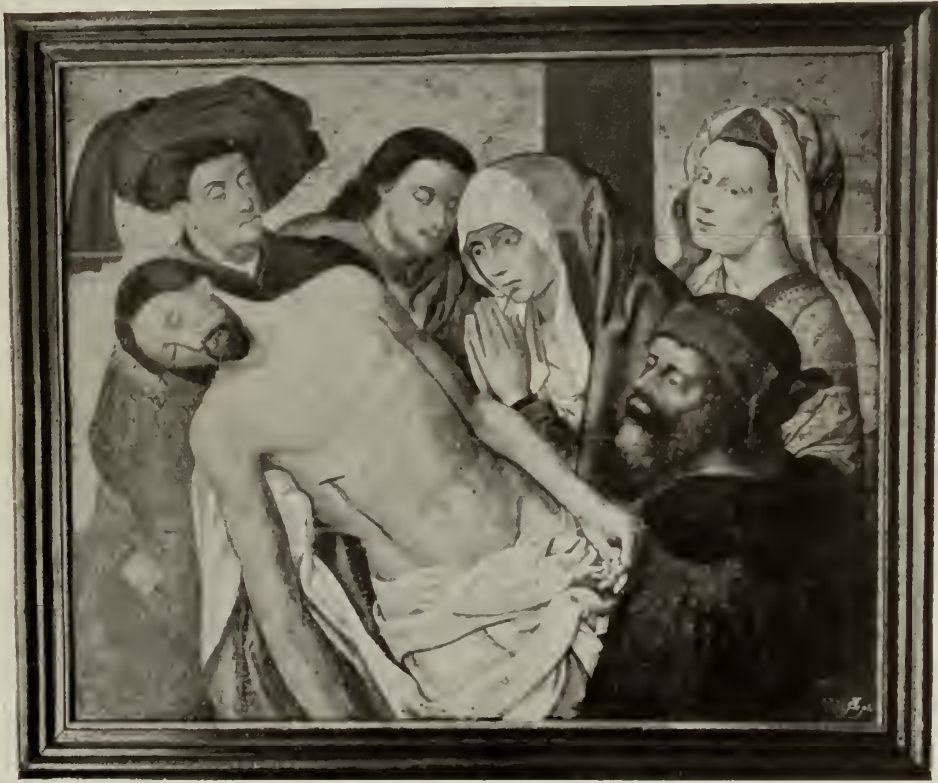
BEGRAFENIS DES HEEREN, vermoedelijk door of naar HUGO VAN DER GOES (omstr. 1480.)

Noemen wij hier slechts: Le moyen-âge et la renaissance van Paul de la Croix, Paris 1848-51 — Les arts somptuaires. Hist. du costume et de l'ameublement door Hangard-Mangé. — Histoire des arts industriels au moyen-âge et à l'époque de la renaissance par Jules Labarte, Paris 1864-66. — Welby Pugin's Glossary of ecclesiastical ornament and costume , London 1868. — Bock's Geschichte der liturgischen Gewänder 1859; en Rheinlands Baudenkmal des Mittelalters van denzelfde. — Les Evangile