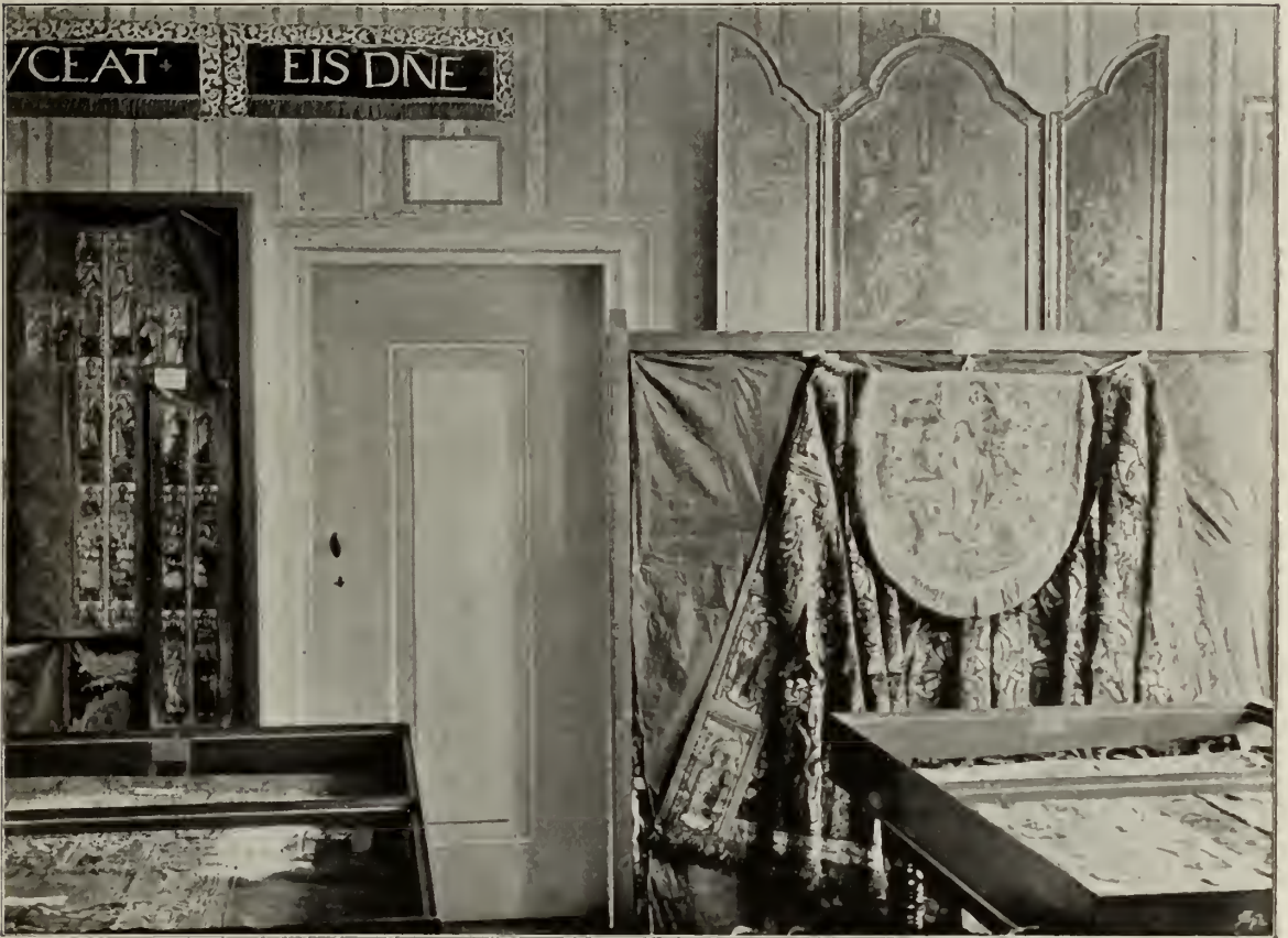
BISSCHOPPELIJK MUSEUM TE HAARLEM. PARAMENTENKAMER.

uit de letters zelve voortgroeit, zich volkomen daarnaar voegt, en daarmee in het innigste verband blijft. Daar ziet men, hoe de kunst speelt met eene losheid en eenen rijkdom van vinding, dat het, om met Pater Weisz te spreken, een lust is het te bestudeeren. Men aanschouwt bijna in elk boek eene eigene manier; maar men ziet die tevens gelijkmatig volgehouden heel het handschrift door. Men be-