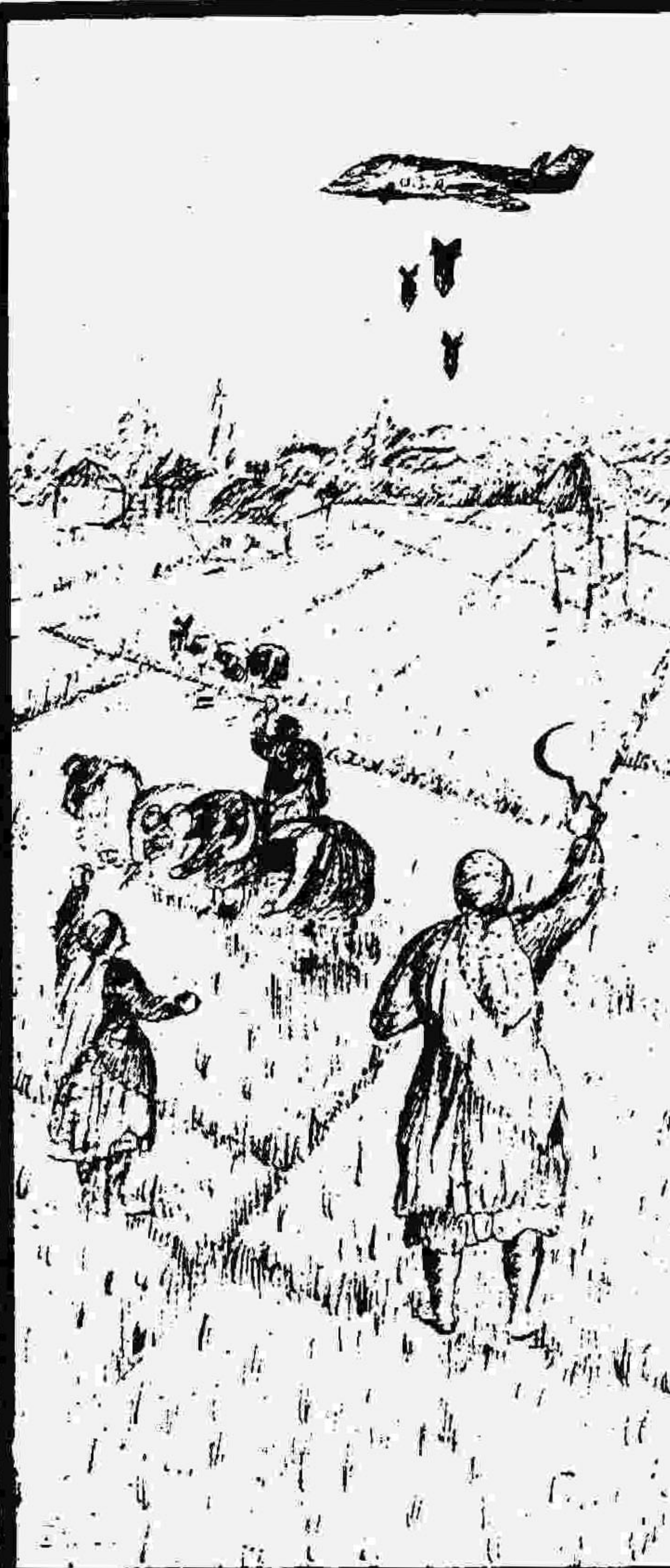
ما در گشتزارها علیه صدام آمریکائی می‌جنگیم

(چکیده‌ای از آنچه روستائیان ما می‌گویند و مینویسند)