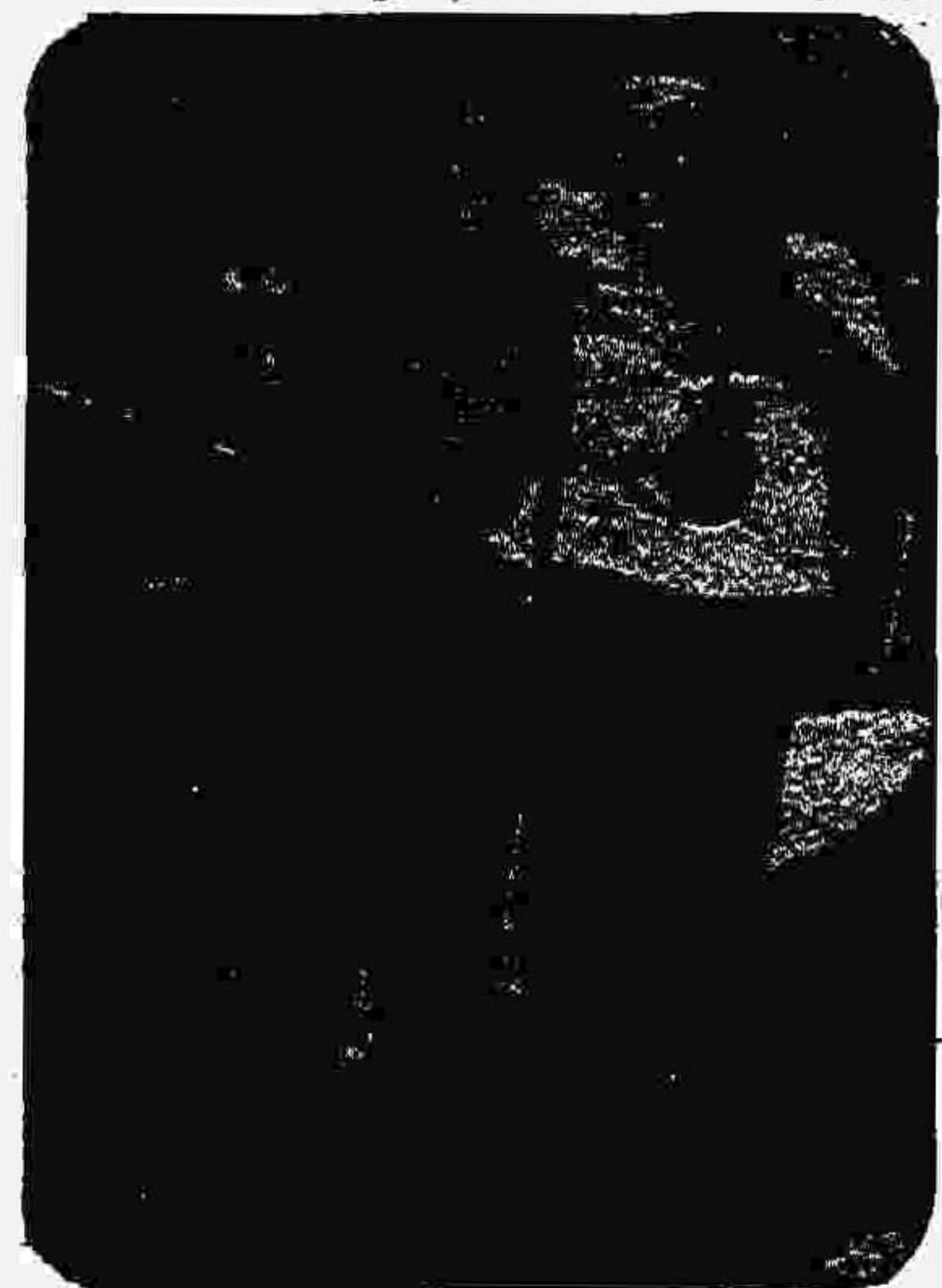
این کودکان بی‌بائی کار کردن باید تحصیل کنند

شاید مشکلترین کار در این کارگاه، خارج کردن شیشه‌های "قلیان" و "گلدان‌ها" از گرمخانه باشد. محیط تنگ و تاریک گرمخانه، با اینکه کوره آن از روز قبل پس از پایان‌کار خاموش شده، هنوز بیش از ۷۰۰ درجه حرارت دارد و انسان قادر نیست بیش از سه یا چهار دقیقه در آن دوام بیاورد. کارفرما، از آنجاکه هیچکس مایل به این کار نیست، کودکان را وادار به این کار می‌کند.