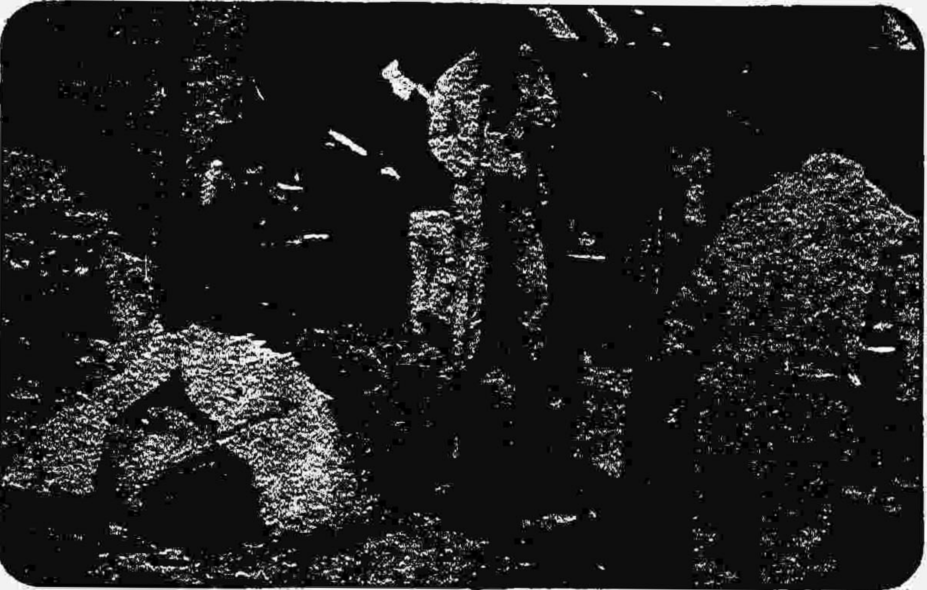
ما اینجا روز بروز تحلیل می‌رویم و کارفرماها در نتیجه کار ما پولدار می‌شوند

گرمخانه، شیشه‌ها را در دوجار سرد دردمی‌کند و تنفس را مشکل می‌سازد. کارگران مجبورند در چنین شرایطی روزی هشت ساعت در مقابل گرمای کوره‌هایی که بیش از ۱۵۰۰ درجه حرارت دارند، عرق بریزند و کار کنند. فضای کارگاه آنباشته از دود حاصل از سوختن نفت سیاه است، که انسان را دچار سردرد می‌کند و تنفس را مشکل می‌سازد. کارگران مجبورند در چنین شرایطی روزی هشت ساعت در مقابل گرمای کوره‌هایی که بیش از ۱۵۰۰ درجه حرارت دارند، عرق بریزند و کار کنند.