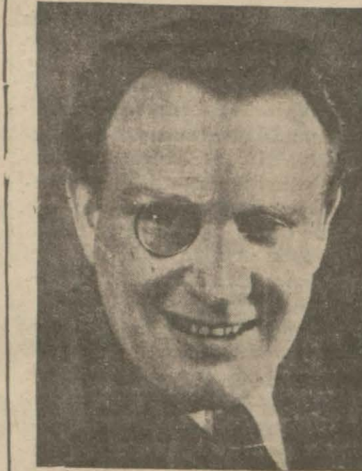
Dün akşam Viyana radyosunda şarkı söyleyen Richard Tauber

Kahire radyosunun programlarını dercedememizin yegâne sebebi programın vakti zamanında elimize ulaşmamasıdır. Programlar vapurla geldiğinden ve epeyce geç tanzim edildiğinden diğer programlarımız intişar ettiridenden beş altı gün sonra vasıl olmaktadır. Bunların daha evvel gelmesi için teşebbüsatta bulunulacaktır.