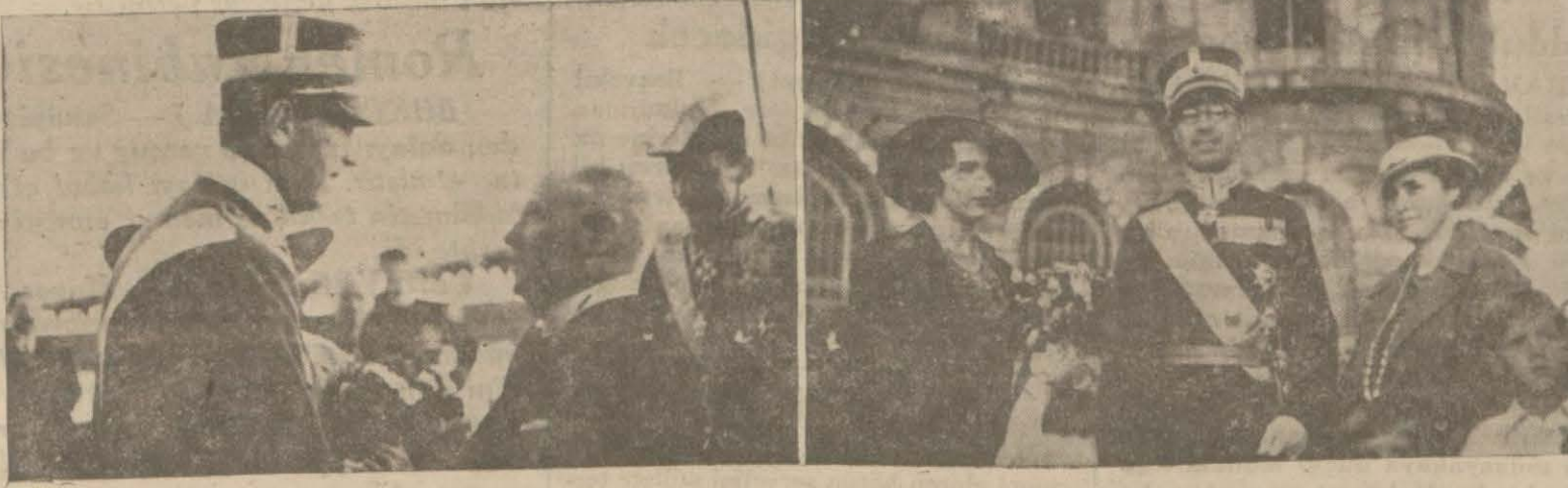
Soldaki resim: Velihaht Gustav Adolf Hz. Haydarpaşada eski ve şimdiki İsveç sefiri ile konuşurken. Sağdaki resim: Velihaht Hz. ile refikalari Prenses Marie Louise ve kerimeleri Prenses Ingrid Hazretleri

Japonları bu muameleyi bitirmeğe sevkeden mülahazalar ne olursa olsun, herhalde netice sulh ve müsalemet namına memnuniyetle karşılanmağa değer. Çünkü bu şimendifer alım satımı alelâ-