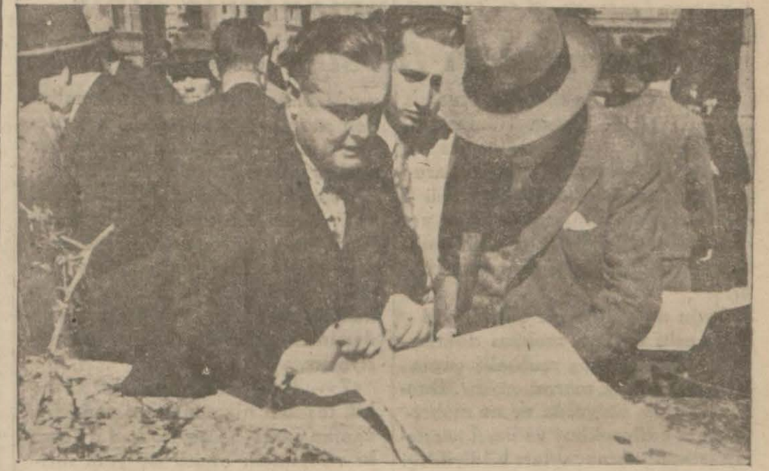
İntihap yerlerindeki heyecan ve kalabalığı tesbit eden bir intiba...