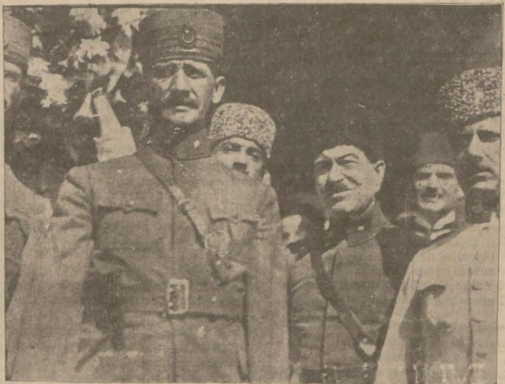
İstanbulun kurtuluş gününde Şükrü Naili Paşa şehre ilk adımını atıyor...

6 teşrinievvel İstanbul kurtuluş günü programının Belediyede toplanan komisyon tarafından tespit edildiğini yazmış-tık.