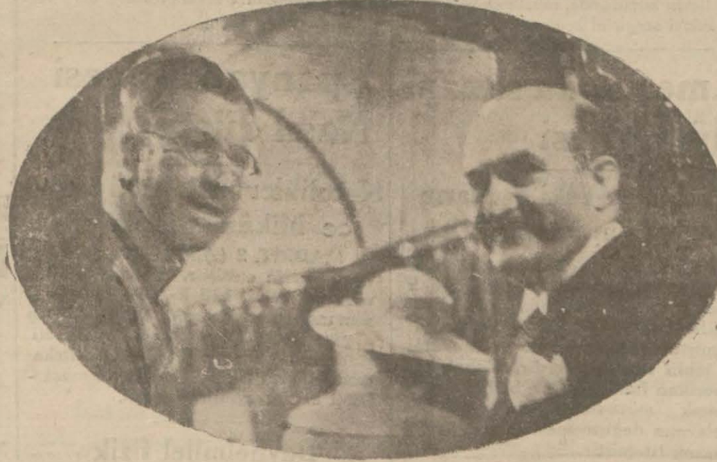
Velihaht Hz. garda