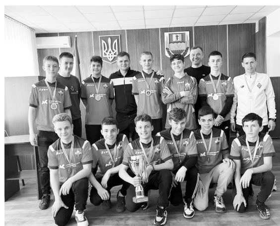
Інф. Макарівської селищної ради