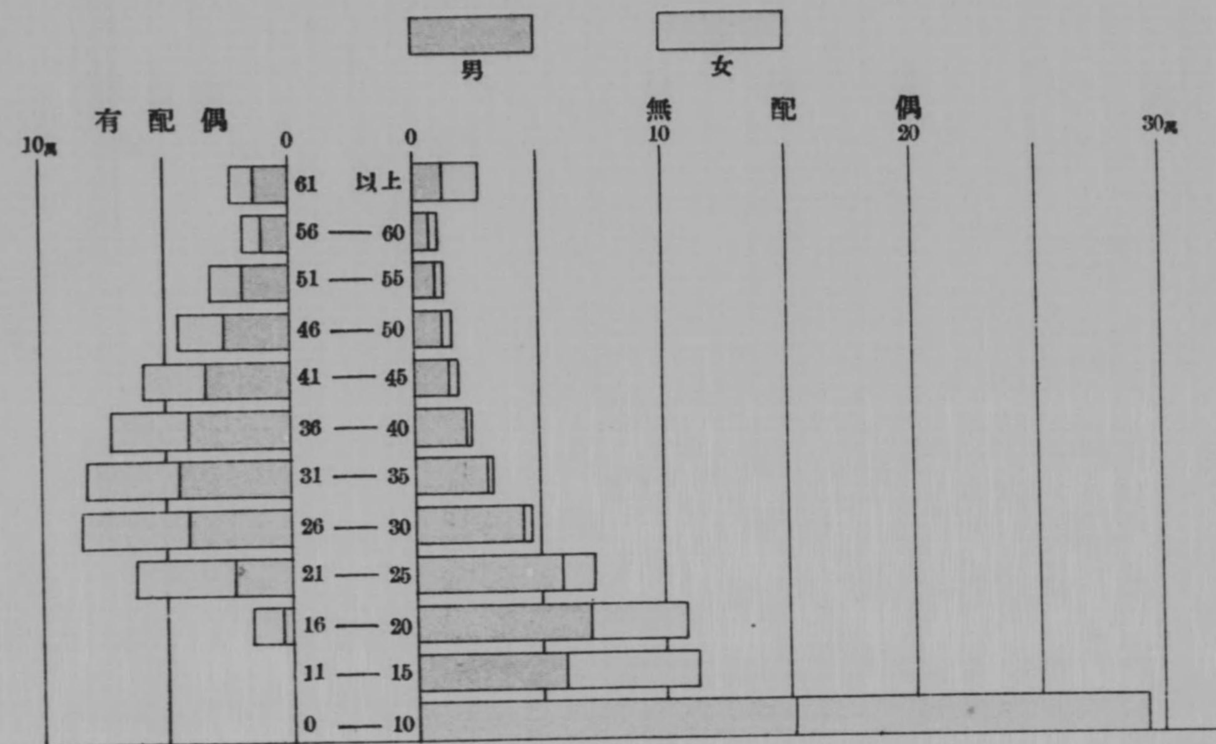
年齡、國籍別配偶關係