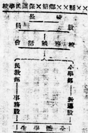
四、學級以下的國民學校行政組織系統表