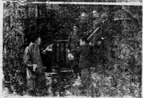
(明說底封看參請)幕三之「家之義忠」拍攝

蔣主席的進餐，是極其簡單的。他幾乎是每一餐都只有兩三樣菜，而且都是家常的。他吃東西，從來不講究，也不挑剔。他吃東西，從來不講究，也不挑剔。他吃東西，從來不講究，也不挑剔。