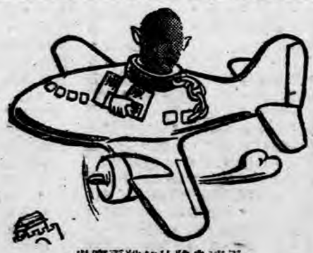
·貴寶更貓熊比將良連更·

秀，越非了一，當裏向恰家求在想是 美秦明謙，天然然美未，一過重做漂 溫怡友，願轉緒一的成那相現慶做亮 柔又以與不一非服威名時任在的好的 ，生上奏了真凡貼力，的主一時朋友演 一得的恰外高，一之嬌秦角忠候友演 天非關作間與那之下於怡的養，員 牌當係超人極時至，哀，秦之追他都