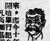
高爾基逝世十年祭