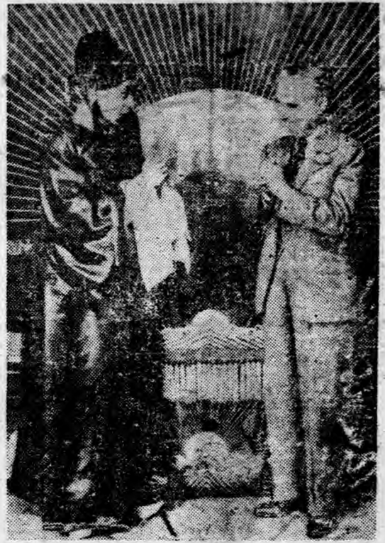
影合台舞在林波買星明影電國美逐披與良連馬伶軒 (字文偶有獨無真本看參請)