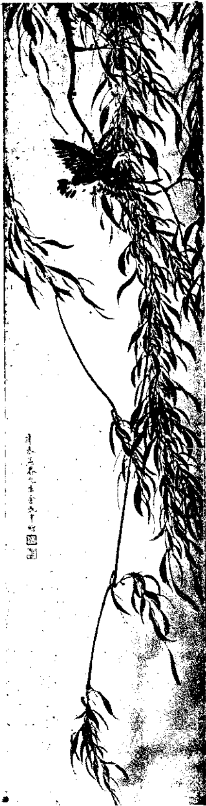
Flower and Bird By Chin Yun Shen