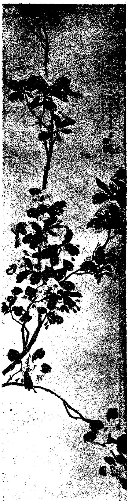
Flower by Kao Pu Chen

意為目的。乃今之繪畫與鑑賞者。既不知精神與物質。又無宗旨與目的。致有專摹上古之死畫者。有愛產東西之雜種者。甚至風景畫內而用廣告畫之背景與色彩者。譬如戲劇。有生且淨丑。不務各盡其長。而乃且頭丑腳生裝淨聲。則尚能成其為有價值之戲劇乎。至於中國畫與西洋畫之異點。由歐美重事實。故其畫之背景係積極的。而色彩以厚重複雜取勝。國人重理想。故其畫之背景係消極的