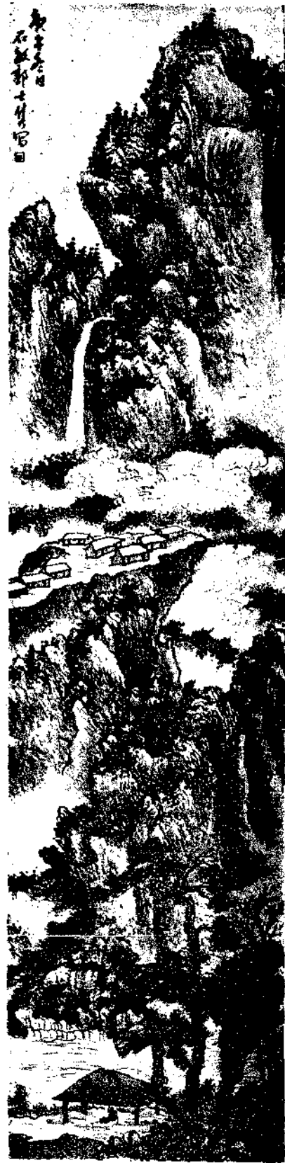
Landscape by Kuo Shih Ming