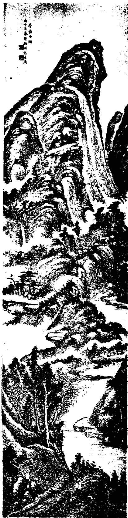
Landscape by Tsai Chu Ang