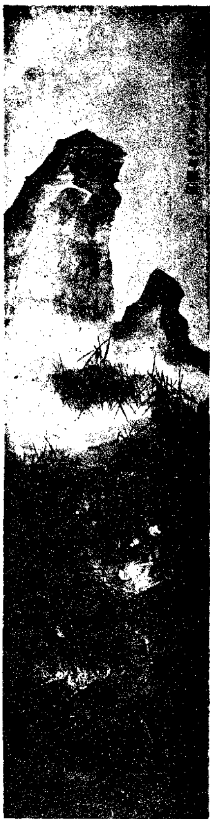
Tiger by Kao Wei Yen

畫之物質藉色彩而顯呈。背景色彩之合乎情理者。則謂之活畫可也。有背景而無色彩。有色彩而無背景。或背景色彩均不合乎情理者。則謂之死畫可也。死畫乃天地間之廢物。豈得以為真善美乎。又有精神與物質而能靈活者。必發展其靈活。以貢獻其功效。然其發展之途徑。因環境而不同。其貢獻之功效。亦隨種類而相異。故繪畫之種類甚多。中國畫界與外國畫各不同。上古畫與近古畫又相異。如風景畫以清幽能安慰人生為宗旨。廣告畫以奇特能使社會注