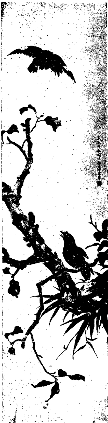
Flower and Bird by Miss Kuo Tai Yu