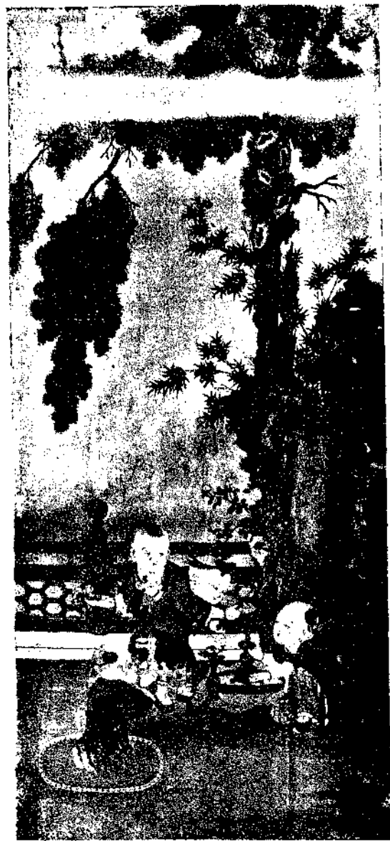
Playing Children by Chen Lin Chai

仍往勢欲斷而忽翔 想晴窗玉腕拈來如 盤鸞鳳笑同伴金鍼 度與只繡鴛鴦于是 技輕珣璜珍藏篋笥 憐刻楮兮何愚嗤刻 棘兮近戲名尊草聖 請看月旦新評人號 鍼神別有風流韻事 遂使瓊閨靜處不參 繡佛之禪綺閣無人