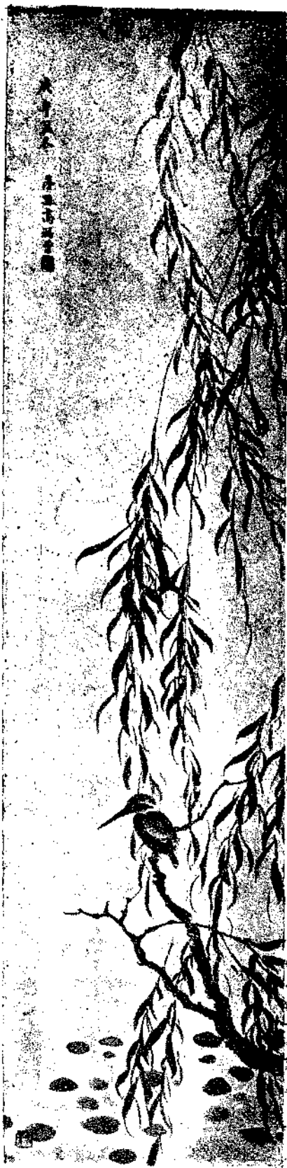
Flower and Bird by Kao Fu Tseng

俗之態。乃所見不廣之病也。以塗脂抹粉為美觀。以清雅淡逸為乏趣。乃所識不高之弊也。愛工筆者之罵寫意。愛寫意者之非工筆。太工過率。雖皆有非宜。所見亦未免太偏。有以中畫而參以西畫之意者。有以西畫而用中畫之筆者。非驢非馬。不儉不類。其意固在創造。所見實已錯悞。古人以繪畫者。必須讀萬卷書。行萬里路。謂其須識多見廣。先能鑑賞。而後其畫乃能得心應手無不超塵絕俗。