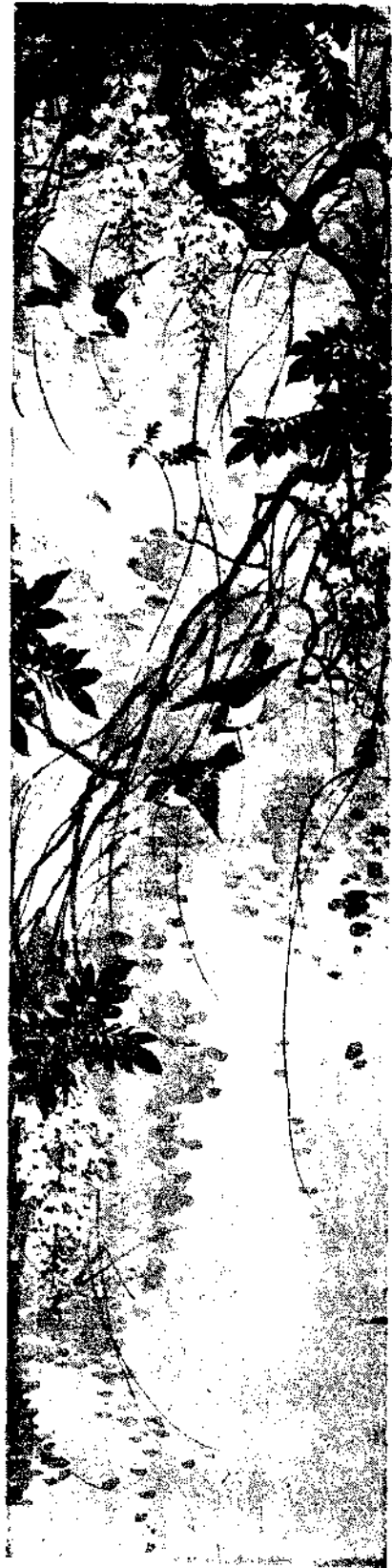
Flower and Bird by Yang Ming