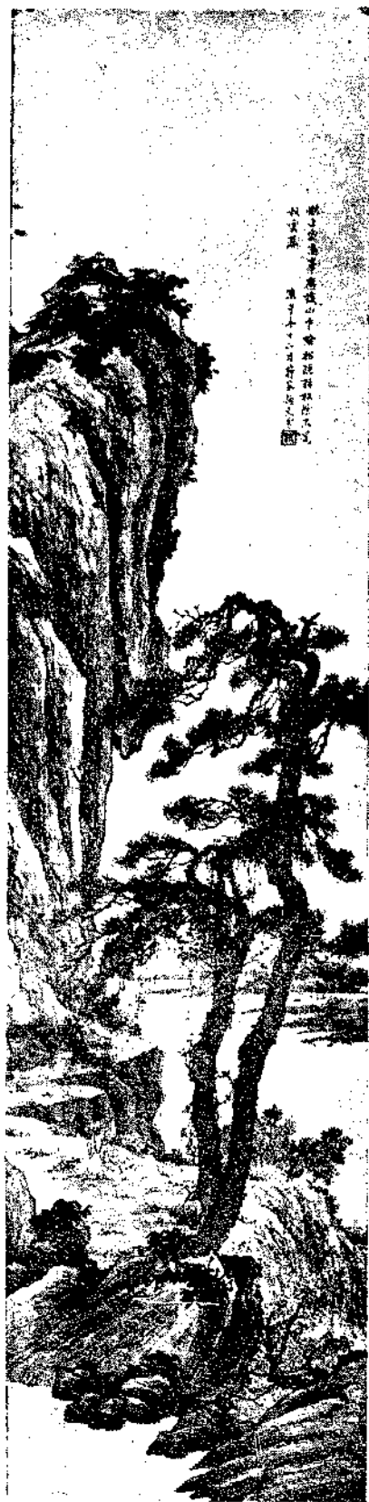
Landscape by Miss Yen Wen Yu