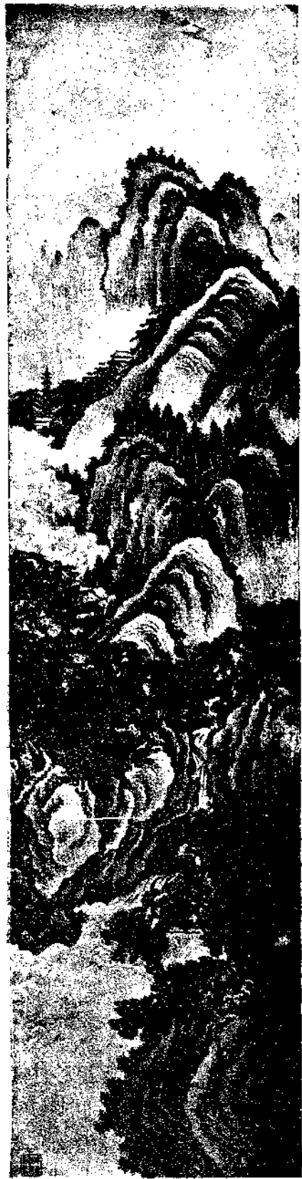
Landscape by Chao Kuo Chang

學書。雖轅行客邸。未嘗一日敢間斷也。臨帖摹碑。毫無所悟。流俗趨時。癡外盲從。雖受庸夫之有許。終愧大家之格風。於民國十七年。棄學謀棲。聞孫嘉祜君。書法絕妙。賞鑒方家。維公振玉。許為五百年來所未有也。予友中吳君。與孫君係戚。因薦於公幕下。藉習書法。只以公務關係。未暇一談也。俟後去職。吳君又薦余於警備部。會(厚載)處長處。曾公書法。亦超凡儔。聞亦得諸孫君。予頗蒙公青垂。曾為予講指書法。公云。平直二字。即學書一貫之法也。夫書者。猶人也。道德愈深高。其人愈和平。故字愈平正者。其書法愈工奧也。觀夫漢魏之碑。俱端方古雅。其綽超於唐宋者多矣。故右軍之書法。為萬世聖宗也。他如執法偏巧。尤遠大