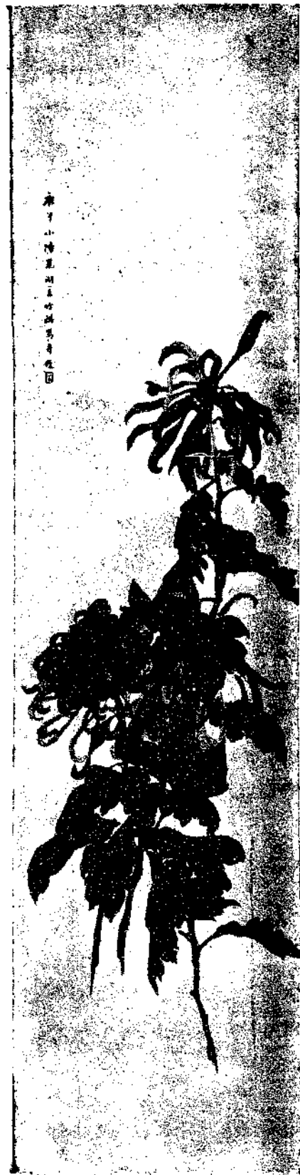
Flower by Wang Chu Chi

雄厚。人生其間。得氣之正者為剛健爽直。其偏者則巖厲強橫。此自然之理也。於是率其性而發為筆墨。遂亦有南北之殊焉。惟能學則咸歸於正。不學則日流於偏。視學之純雜為優劣。不以宗之南北分低昂也。 (未完)