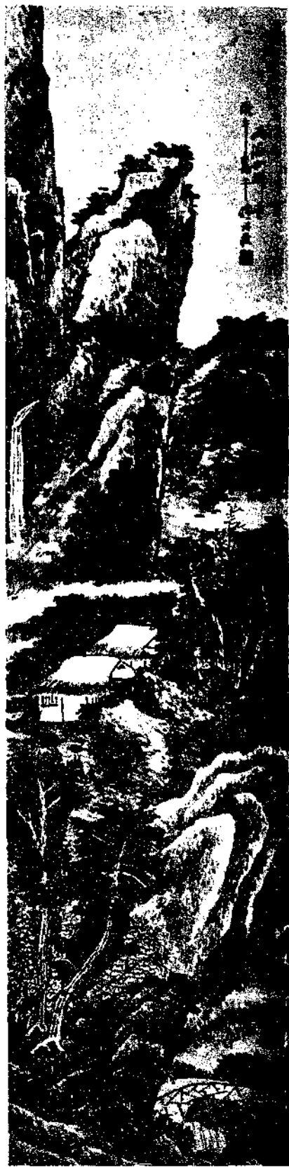
Landscape by Tung Chi Chuang

筆硯精良人生一樂余亦云然時舟中章鍊師岳隱者對奕吳老生吹洞簫 案南山謂荆南山一統志荆南山在宜興縣西南 三十里荆溪之南一名銅官山岳隱者乃岳榆吳 老生即國良章鍊師當指章心遠本集寄章心遠詩江海章高士相遠已半年是也 又案本集與張介石詩云奉別後從蘭陵東郭門外人家少憩 三日待荆溪發行李來即歸田舍到家稍稍休歇而州縣差科迫促騷然因嘆安能復以憤憤從彼之榛榛乎便命扁舟入吳萬村落中調氣靜坐得 以少抒其中磊磊者一日從一二林下人登靈巖山覽觀天池石壁之勝尋姑蘇臺古跡若司馬子長蘇長公悲世憤俗有不勝其哀後百世而不見 古人則求古蹟觀以自解情不肖非其人因望太湖之西諸山隱約指點數螺若芥舟泛泛水中者當是銅官山竝吾寄止公政著白雲滅沒處閉門