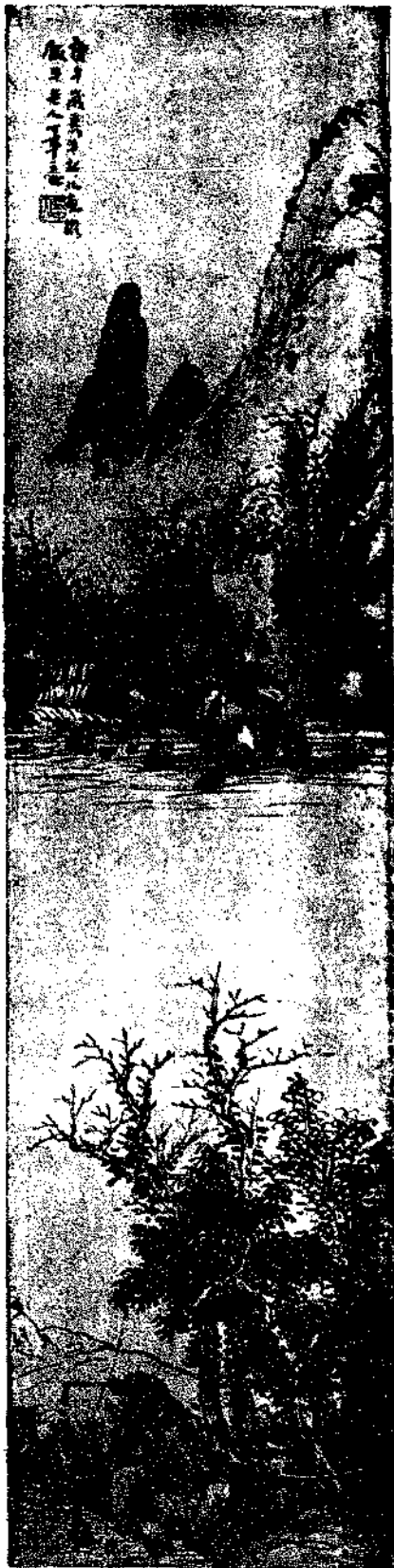
Landscape by Niu Hsin Pei

深崦藏雲長川帶薄高下數家村落出林莽杪在水聲中清境相於足適襟趣 崇巖之腹平坂寬然用闢衡門樹翠納牖俯瞰陰崖曉霧雲氣生寒知為熱客所不到也 緣溪路坦覆野林疏幽居三兩家門對秋容靈襟颯颯知占邱壑美不作江湖夢也