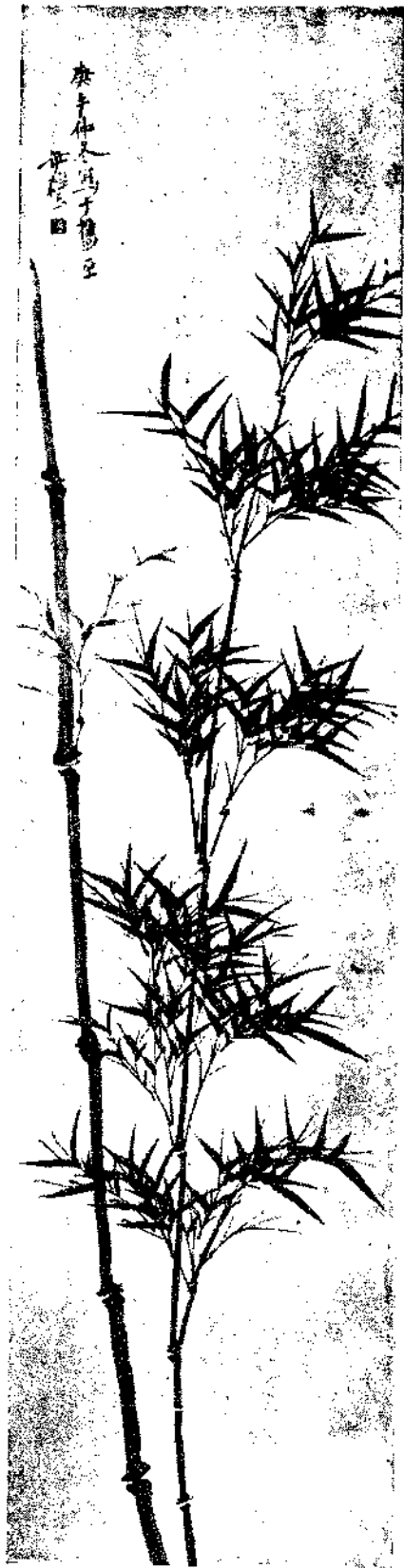
Bamboo by Miss Hsu Chih Chun