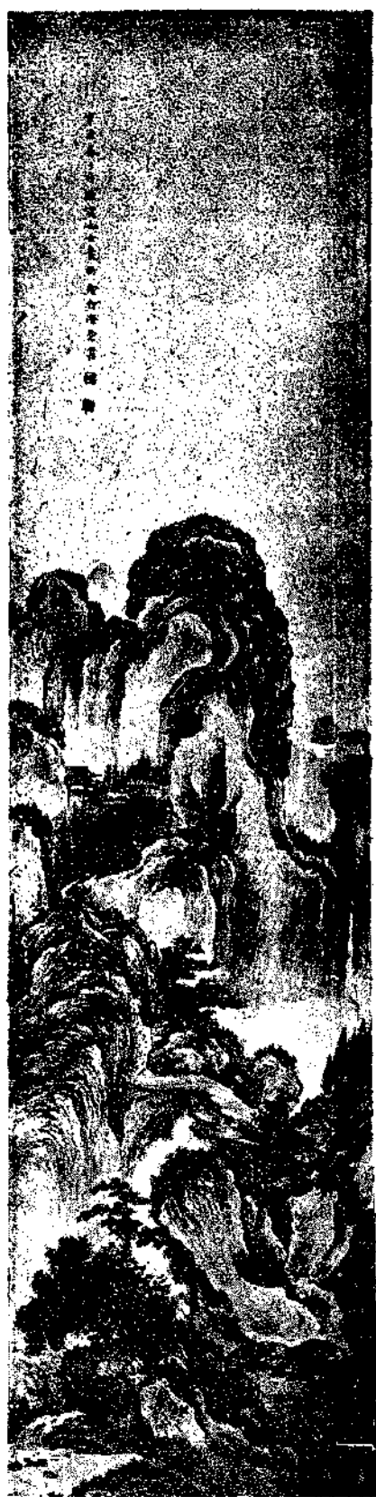
Landscape by Miss Yuan Fang

畫學心印。案誼廷祖永。編輯繪事津梁。桐陰論畫。山水人門畫訣各書。惟心印為最博恰。集古今畫說六十餘種。取材豐富。註釋精詳。