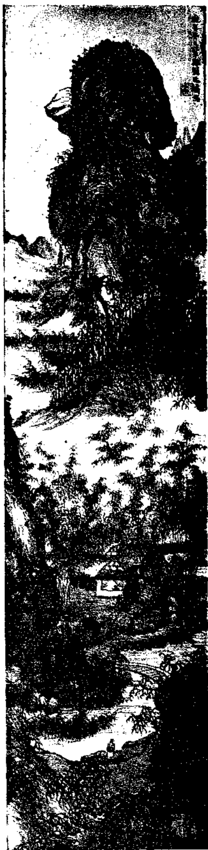
Landscape by Liu Yen Tao