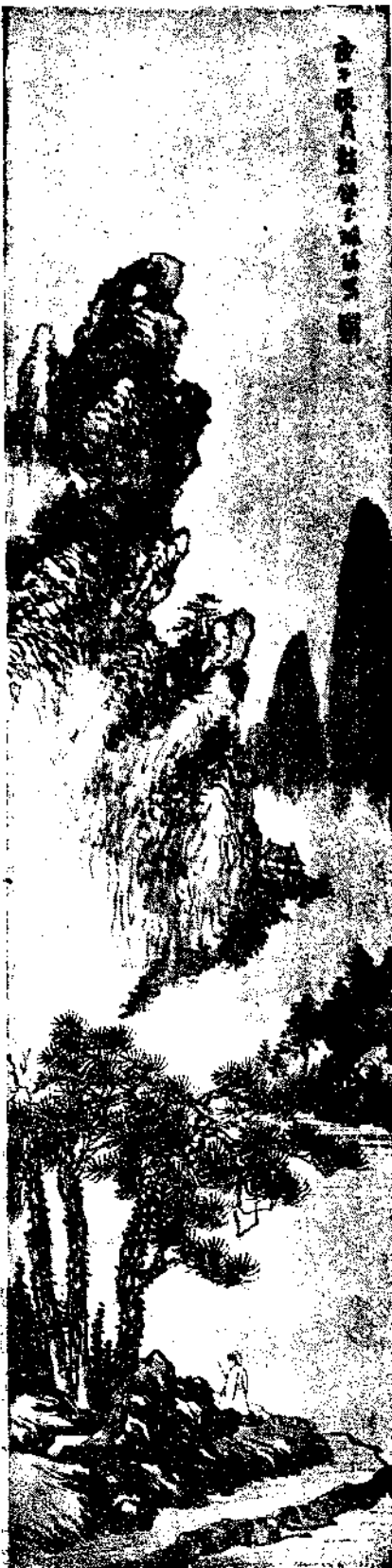
Landscape by Chao Chung Yu

成。若鄭燮之怪。則豈足以取哉。蓋人之各異者。其悟筆法。有所不同耳。余竊公筆法。悟於一刻。歸寓私幕。勝熟十年。昔褚河南云。蓋非口傳手授。而云能知者。未之見也。至哉斯言。因成詩一首。昔時埋首管窺天。今始觀天那得邊。一旦嵩山開妙法。方知片刻勝十年。