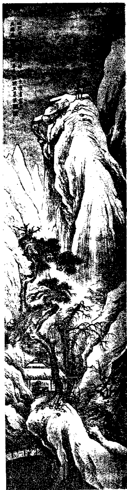
Landscape by Wang Mu Chiao