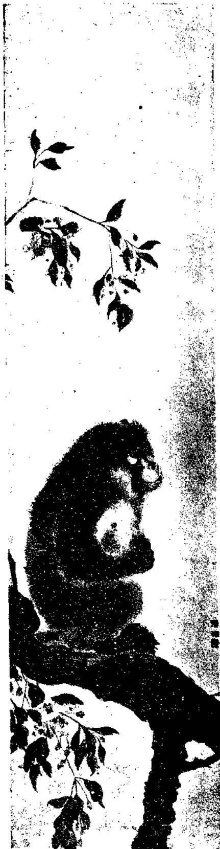
Monkey by Chang Li

丁巳中伏甌海孫衣言謹題 揮灑層城茂苑詞千秋元氣尙淋漓誰將海岳沈雄筆扣入天孫宛轉絲字燦珠璣逾刻畫思抽綺組得靈奇踴螭翥鳳邀題賞朱邸僊才麗藻擲何須