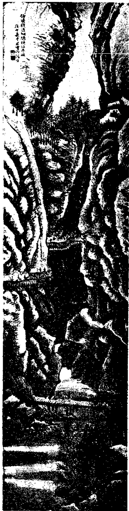
Landscape by Pai Yu Hsiang