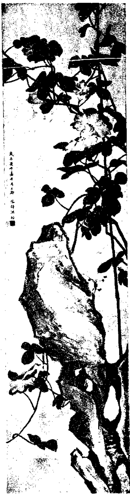
Flower by Miss Hung Yi

江上畫筌。笈重光。分輯書笈畫筌。暢言繪苑流傳。大都高人酌士。寫其胸中逸氣。否則人非其人。畫難為畫。著約六七千言。一氣呵成。儼詞比句。內分十段。一山。二水。三樹石。四點綴。五時景。六鈎皴。七用筆墨。八設色。九雜說。十總論。至闡發種種通病。語尤詳盡。直謂粗浮不入。雖濃郁而中乾。渲染漸深。即輕勻而肉好。閒色以免雷同。豈知一色之變化。一色亦分明晦。當知