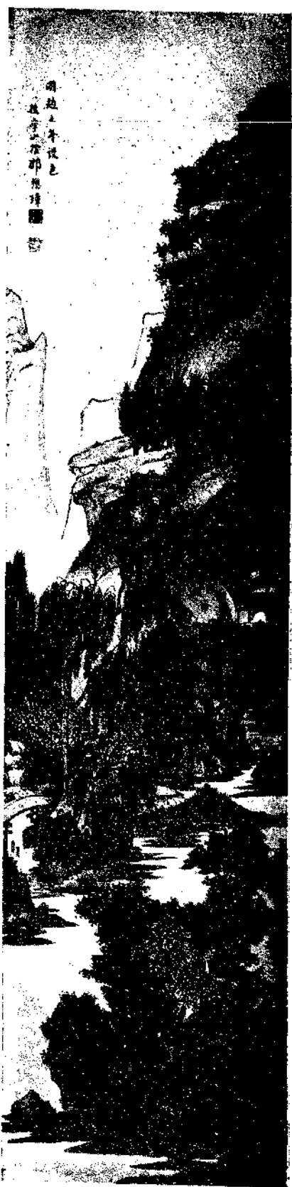
Landscape by Shao Mou Chang

州府 又跋黃子久畫卷云本朝畫山水林石高尚書之氣韻閒遠趙榮祿之筆墨挺拔黃子久之逸邁不羣王叔明之秀雅清新其品第固自有甲乙之分然皆余檢衽無間言者外此則非余所知矣此卷雖非黃傑思要亦自有一種風氣也至正十二年三月七日與明道尊師謁張先生因以示余 案清河書畫舫載此跋與集同明史文苑傳王蒙字叔明湖州人趙孟頫之甥敏於文工畫山水兼善人物元末官