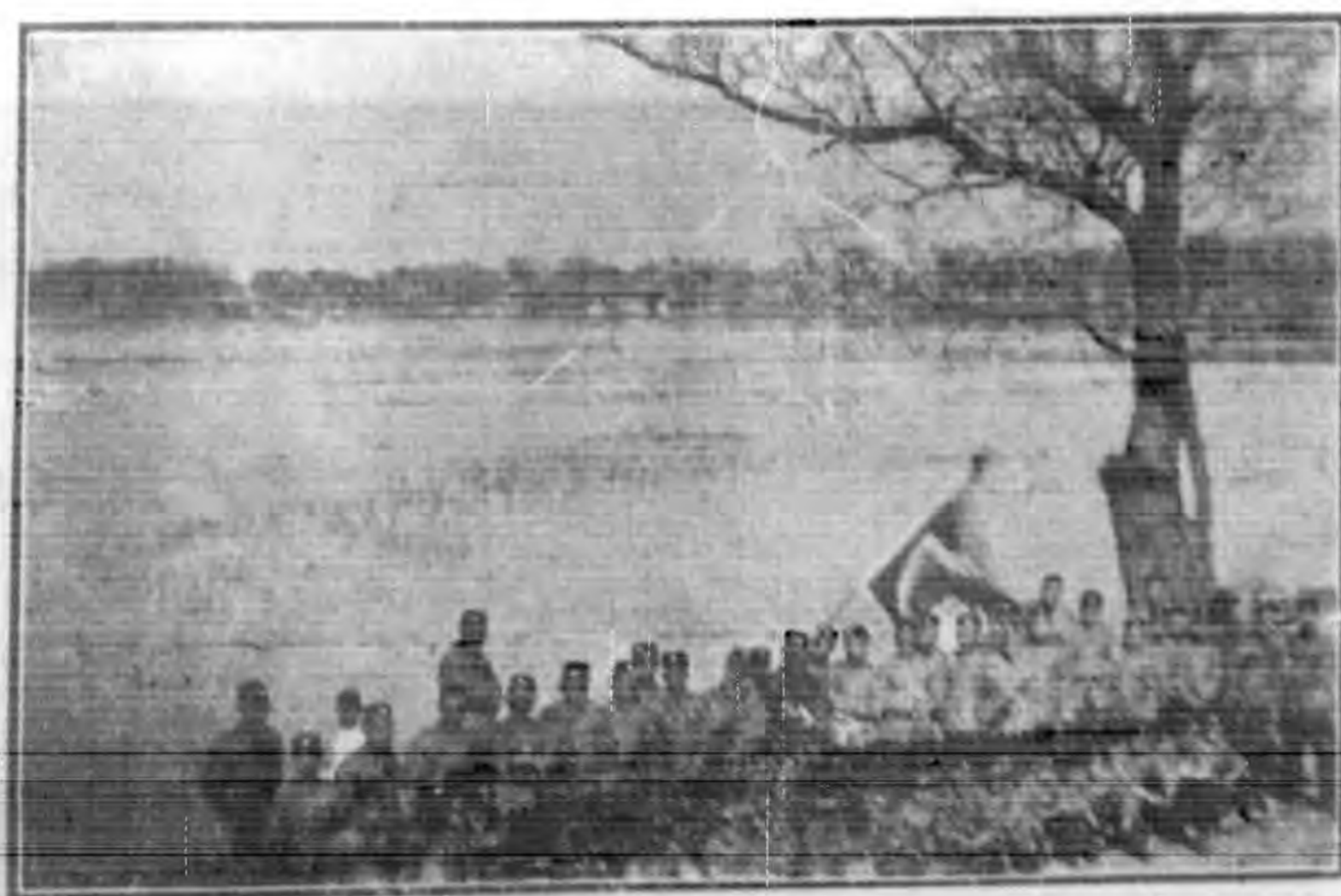
北平成達師範學校師生北海旅行攝影