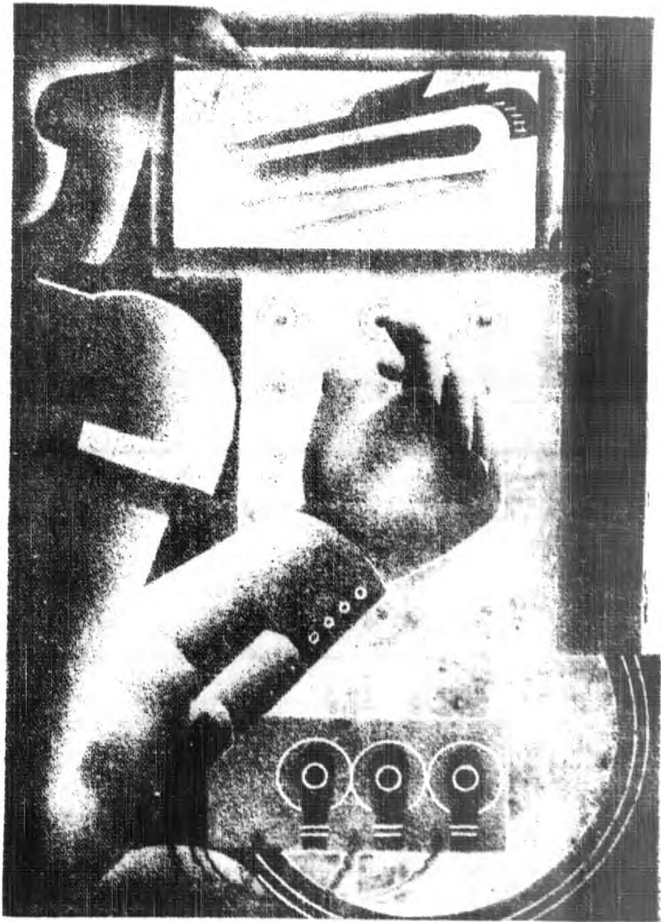
百 年 後 之 戰 爭