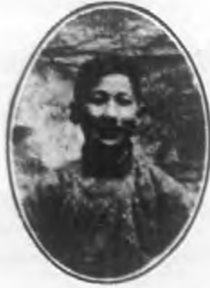
興 邦 胡