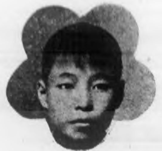
年 益 徐