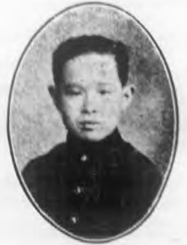
謙 敦 尤