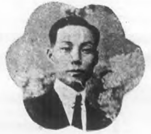
貝 玉 黃