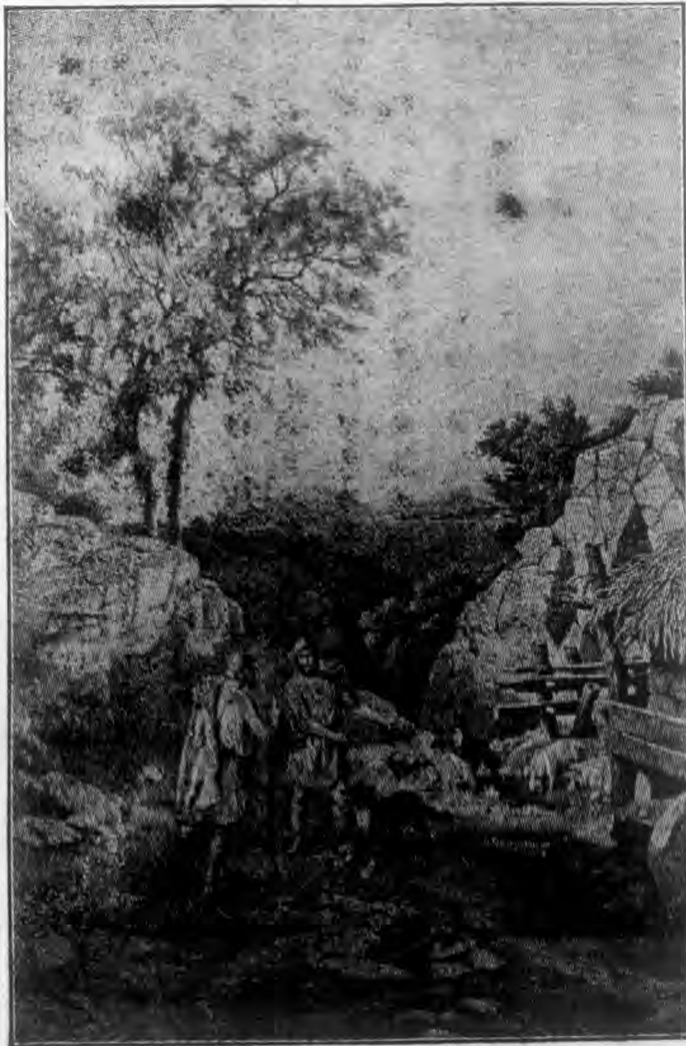
裏那斯阿米攸了到茲栖力攸

攸米阿斯時常坐在門外，用牛皮做他的靴。他的四個助手，十分的忙。三個在草場上看豬，其餘一個却給那班求婚者送豬去。當攸力栖茲走