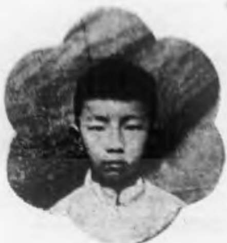
棟 兆 仲