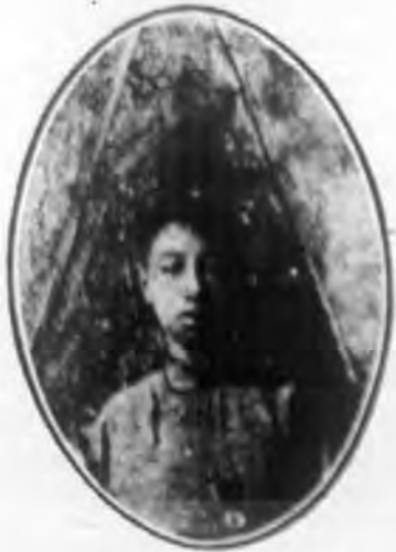
強 君 陸