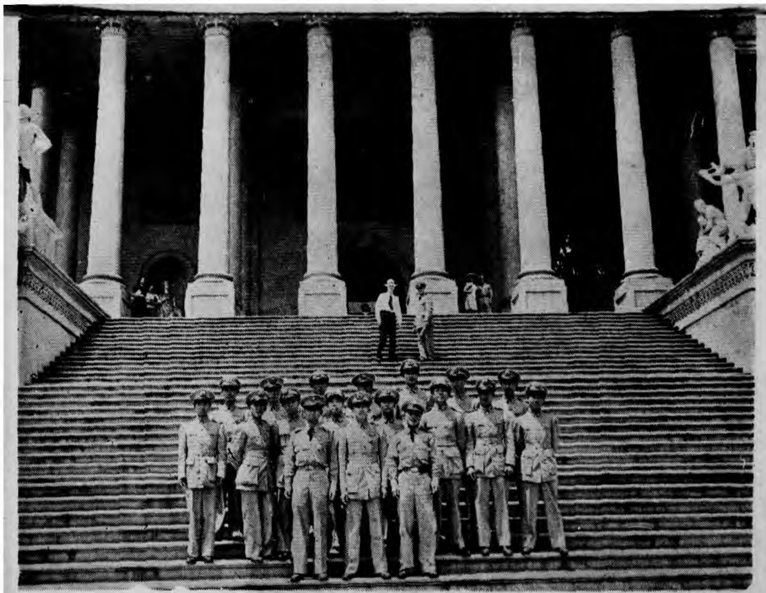
中國空軍軍官訪問美國華盛頓時在林肯紀念堂前留影