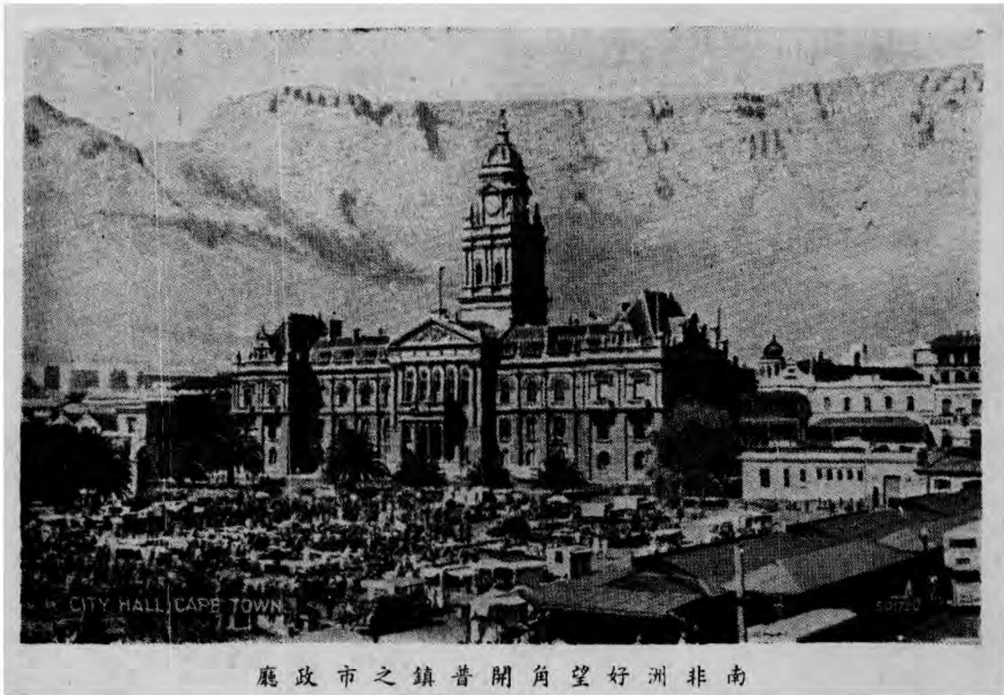
廳政市之鎮普開角望好洲非南