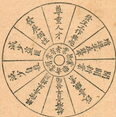
職業指導對於社會的影響

照上面所說的看起來，民生主義是要振興實業，增加生產的，職業指導也是要開闢新業，改善職業，增進生產效率的；民生主義是要禁絕流氓，使得人