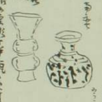
此の器は... 灰色... 山白地... 漆器...