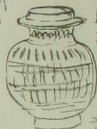
此の器は... 灰色... 山白地... 漆器...