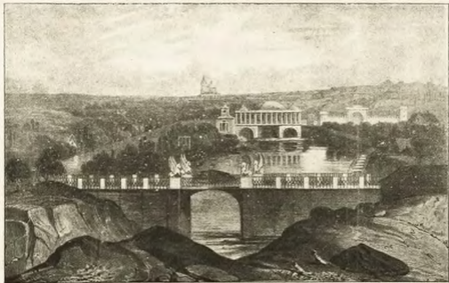
Гороховский садъ въ 40-хъ годахъ XIX вѣка. Видъ изъ Масаровскаго переулка (съ стр. 47).