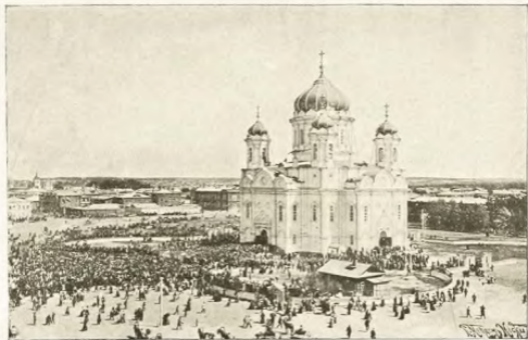
Троицкій соборъ во время освященія его 25 мая 1900 г. (къ стр. 407).