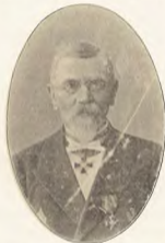
Членъ Комитета и гласный думы.

а деньги 150 т. р. въ силу этого записанія внесены въ городскую управу въ апрѣлѣ 1886 года. Бывшій же городской голова и дума разсуждали о деньгахъ Цибульской и постройки на нихъ тенлага собора и колокольни въ 1884 г., когда еще не существовало и духовнаго записанія и никакихъ денегъ не поступало въ думу. А потому разсужденія эти теперь, при существованіи духовнаго записанія, ничего не значать*.