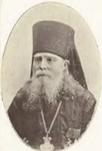
Архимандритъ Иона. (П. I. Изосильевъ).