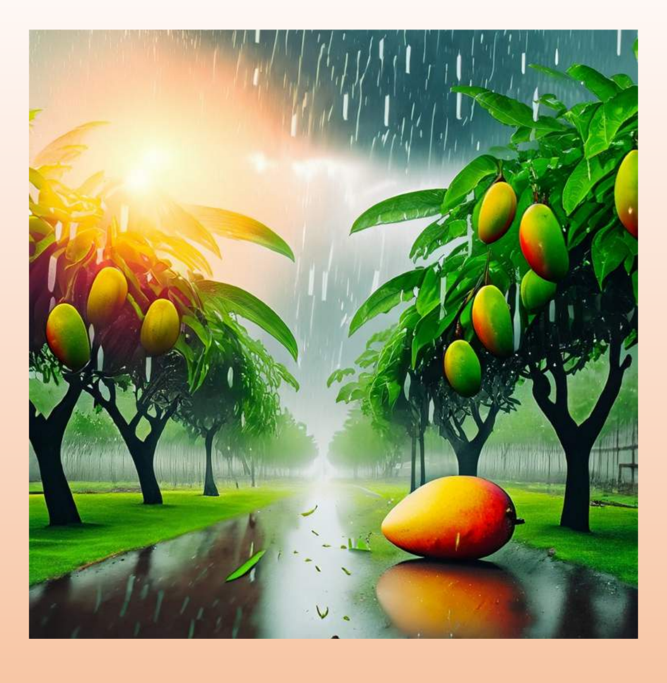
"மரங்கள் மழை பெய்ய உதவி செய்கின்றன."