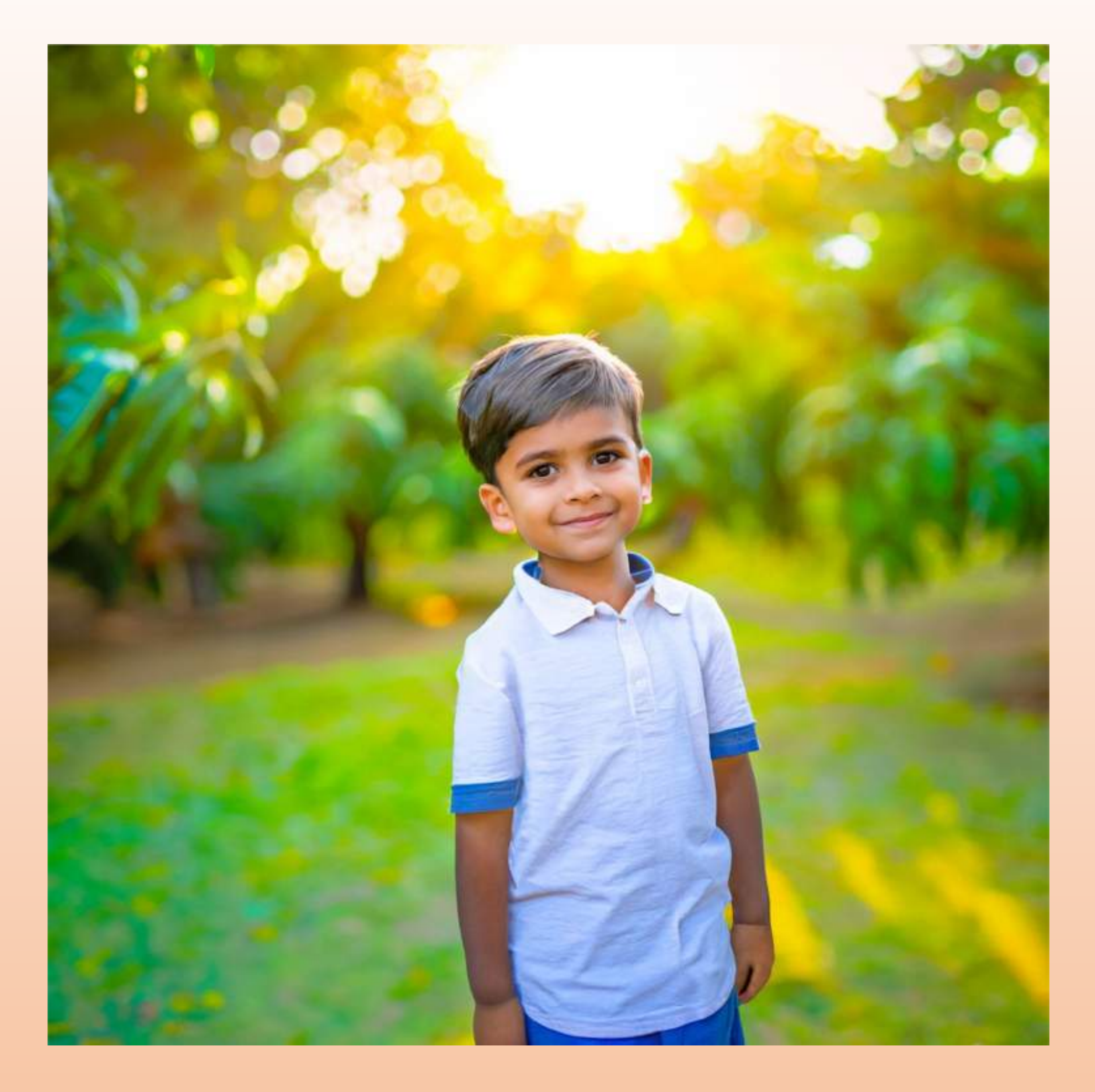
இது தாத்தாவின் மாந்தோட்டம். இங்கு நிறைய மாமரங்கள் நிற்கின்றன.

"ஏன் நாம் மரங்களை நட வேண்டும்?", அம்மாவிடம் கேட்டேன்.