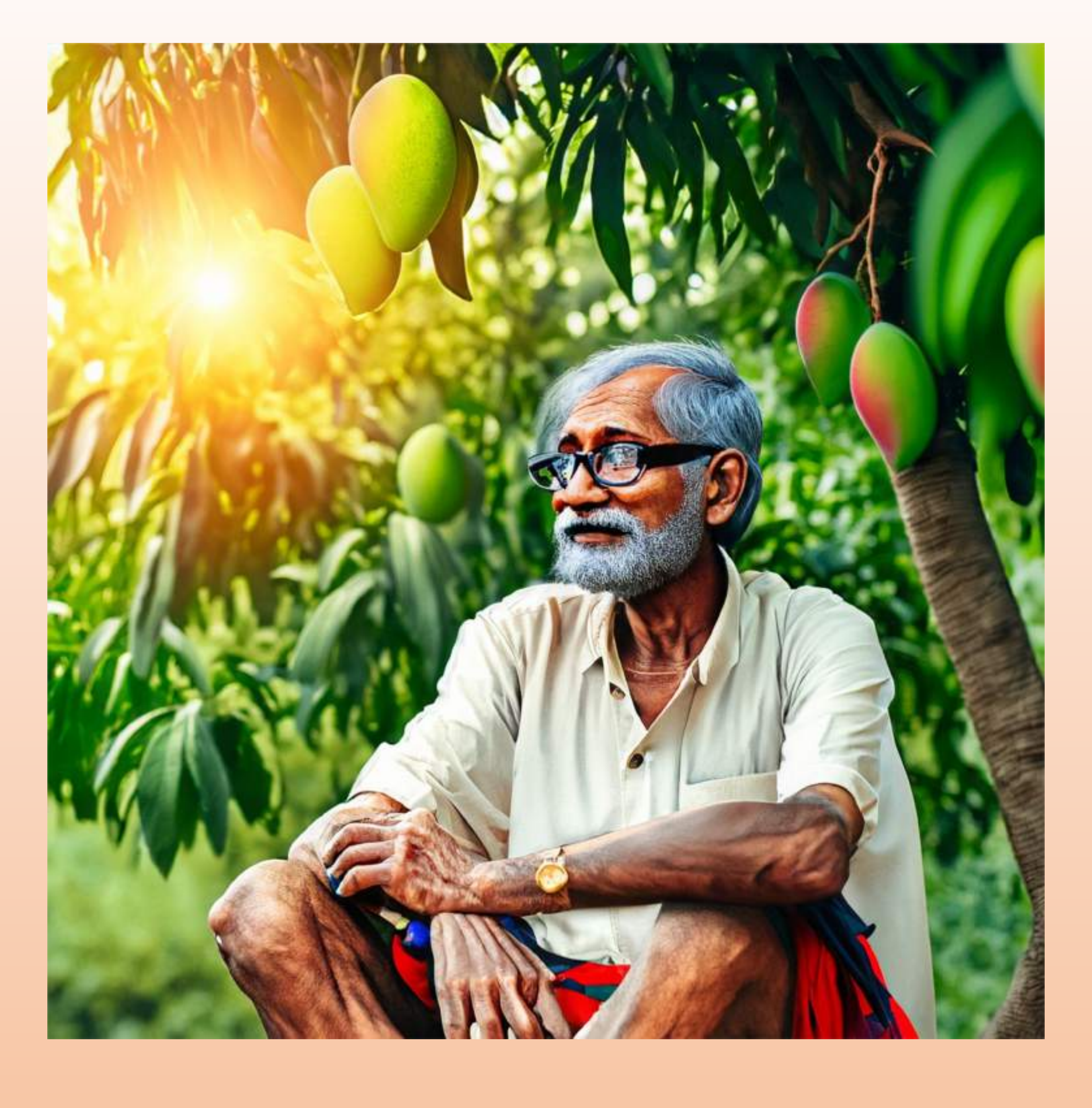
"மரங்கள் வெயில் காலத்தில் நிழல் தருகின்றன."