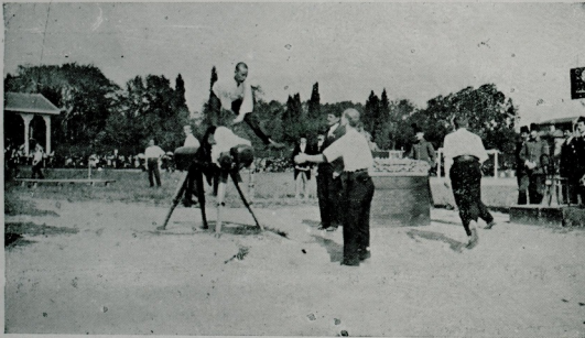
دارالمعلمین عالیئک (سبور) حیانتندن یوسته ایلك بهارده اجرا ایدیلن ادمان بایرمانده آتلامه مسابقه‌سی آساننده

مقدارده تکرار ابتدیریور . طبیعی بوتقسیات دوغرو دکلدر . چونکه قول و باجاق نه معادل ، نه مساوی عضولر اولدیغندن وظیفه و فعالیتلری ده بشقه بشقه‌در . (غوتس موتس) ک پروغرامنده یونان قدیم، رسه لرندن یاریشلر ، آتلاملر ، کوره‌شلر ، قرض - (disque) و جرید. (javelot) ایله افقیاً موضوع مدور قالبین برصریق اوستنده موازنه‌تعلیملری شاقولی