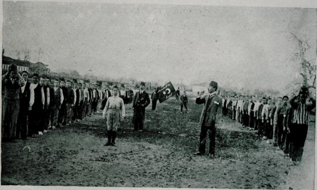
بیغا - عثمان غازی مکتبی کورپوزلرینک کنج درنگری تعام میدانده طوب اوپونی اونارکن

قلبری خسته بولنانلر حقهده جاری اولان اشبو قواعد ضغیت عمومی بدنیلهری ویا عضویهری اولانلر ایله جکر ضغیتی، فقرالدم، سولهتدی ویا عمود فقری بوزوقلغندن خسته اولانلر حقهده دخی جاریدر. بوتون بوکچی ضیفلرک انتخاب و تفریقده بغایت دقت و بصیرتله حرکت ایدلسی و بوکا مخصوص بر تعایباتنامه وجوده کتیرلسی لازم کلدیکنی بر دفعه دهها ذکر ایتیش ایدم . ایشته بوتک ایلك نتیجهسی اولهرق : اولا : اردودهکی