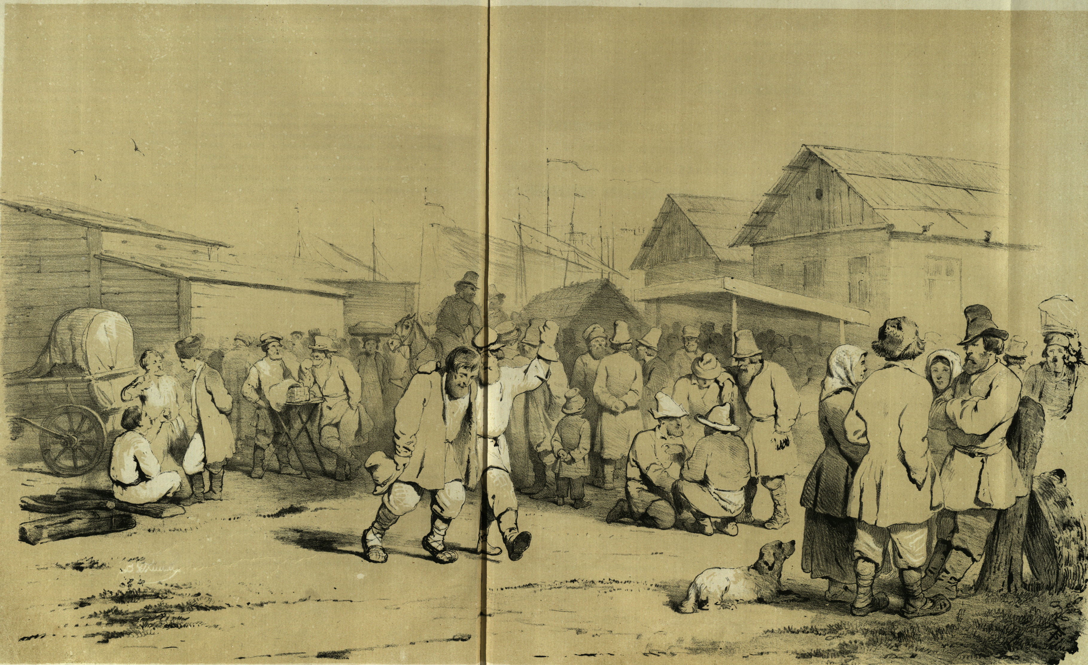
Сцены Нижегородской Ярмарки, съ рисунка Художника А. Чернышева.