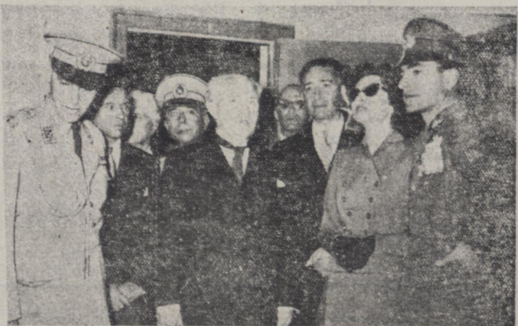
هنگام بازدید اهل حضرت حمایونی و هلیا حضرت ملکه از گورخانه یکی از متخمسین کارخانه توضیحات لازم را بر سر می رساند. آقای نخست وزیر نیز شرفیاب می باشد.

مراسم سان و ورثه ساعت چهار بعد از ظهر دیروز مراسم سان و ورثه واحدهای لشکر ۹ شد. مقارن ساعت چهار و ده دقیقه بعد اصفهان در میدان فرح آباد اصفهان در پیشگاه اهل حضرت حمایونی بر گذار در این موقع دسته موزیک سلام شاهنشاهی را نواخت و کارود احترام مراسم احترامات نظامی را بجای آورد.