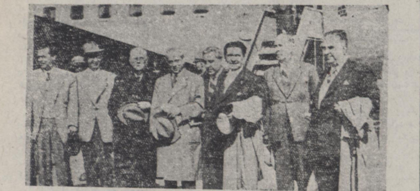
اعضای هیئت روزنامه نگاران ترکیه هنگام ورود در فرودگاه مهر آباد دیده میشوند.

هئور کارشناس نفت وزیر امور خارجه امریکا اظهار داشته است: کمپانیهای نفت امریکا قصد ندارند در امر نفت ایران دخالت نمایند. هئور پنچروز در لندن توقف خواهد کرد و گزارش مطالعات خود را در ایران به دالس وزیر خارجه امریکا تسلیم میکند. دولت امریکا این بار بحل مسئله نفت ایران بیشتر اطمینان دارد.