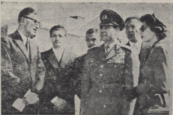
پروژه اعلیحضرت هایونی و ملیحاضرت ملکه از کارخانه توربین اصفهان بازدید کردند. در این محس آقای اکبر مسعود (سارمدوله) هنگام عرض توضیحات بحضور شاهنشاه دیده میشود