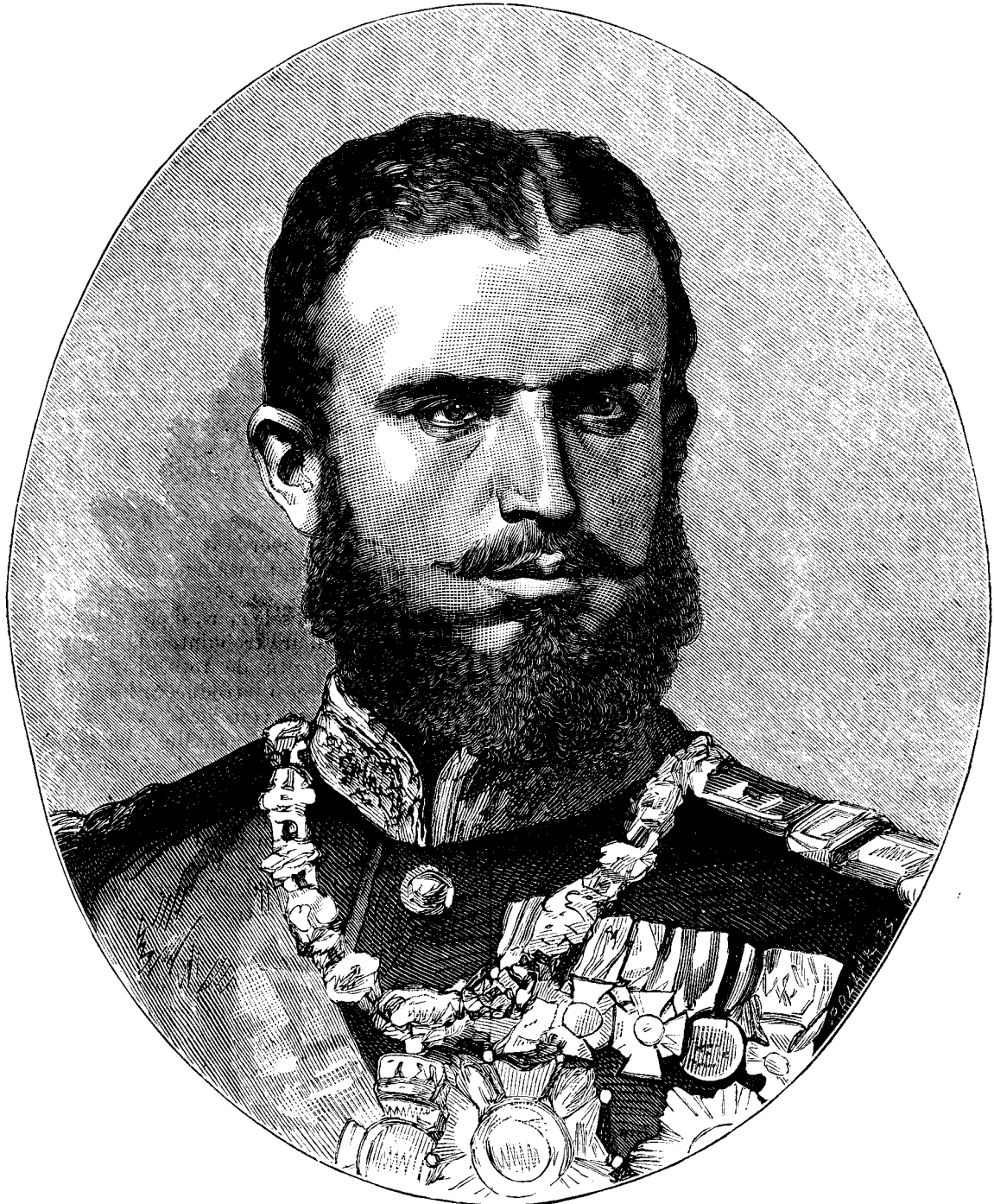
Carol I Domnitorulu Romaniei.