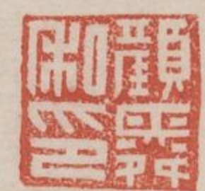
顏舜私印銅印鼻鈕