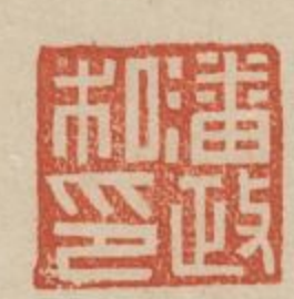
潘政私印銅印鼻鈕