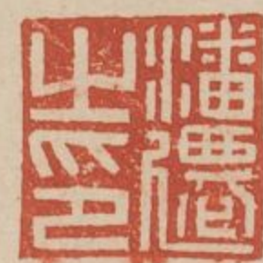
潘遷之印銀印辟邪鈕失子印