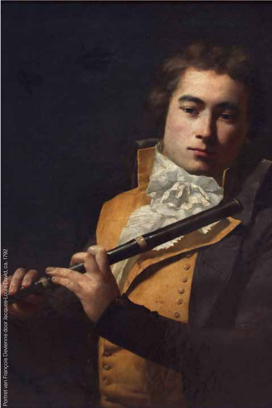
Portret van François Devienne door Jacques-Louis David, ca. 1792