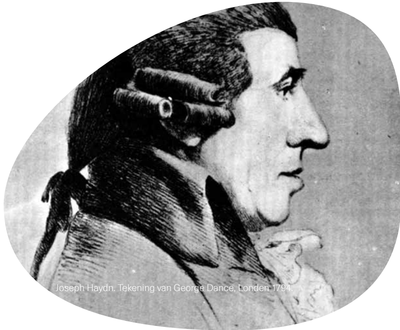
Joseph Haydn. Tekening van George Dance, Londen 1794.