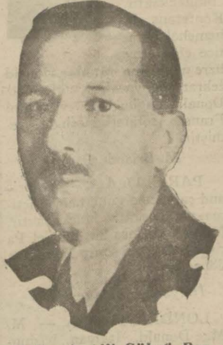
Maliye Vekili Şükrü Bey