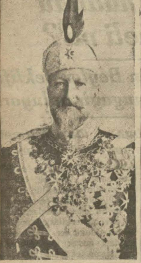
Sabık Kiral Ferdinandu

Ağustosun on dördüncü günü Enver Paşa ile Talât ve Halil Beyler derhal harbe girmemiz için mütemadiyen hükümete sıkırtmakta olan Almanya sefirini görerek Bulgarların da