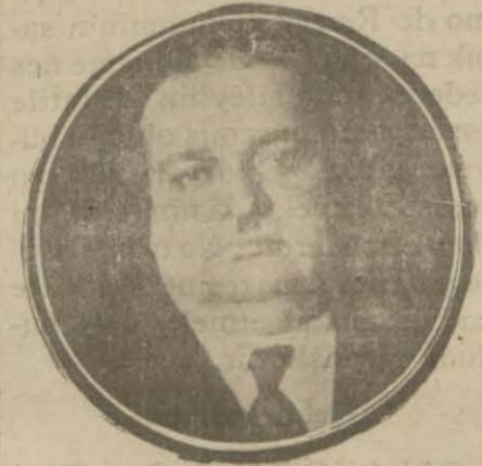
Vali Vekili Fazlî Bey

Heyeti ihtiyariyelerin nasıl teftiş edileceği hakkında geçenlerde Vali vekilinin beyanatını yazmıştık. Bu beyanat, etrafında yapılan bazı neşriyat üzerine meseleyi bir muharririmiz Vali Vekili Fazlî Bey'e sormuştur. Fazlî Bey şu beyanatını vermiştir: