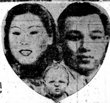
好 小 中 希 我 下 圖 胡 的 望 們 為 中