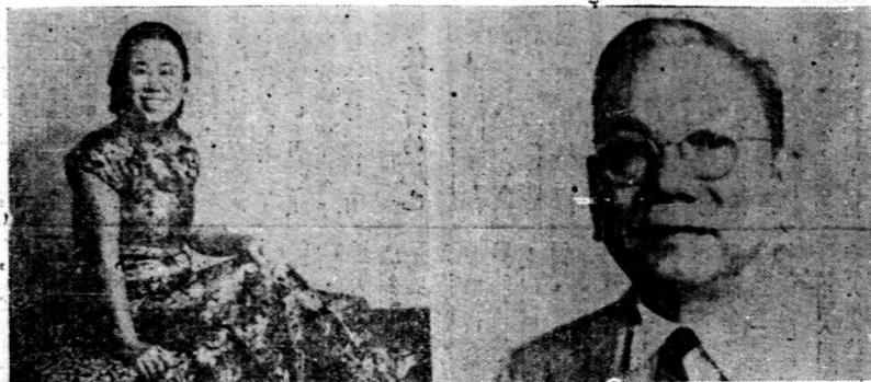
親母的福厚 个 人夫虎文胡