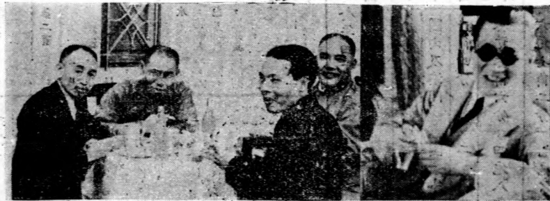
英世許，笙月杜，揚維阮，顧曉王，城鐵吳席主粵前：左至右由賓來