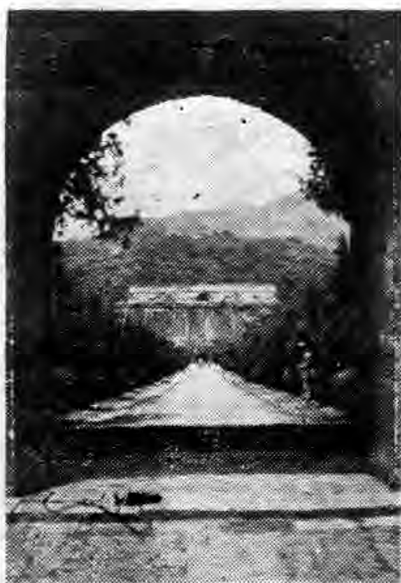
明 孝 陵

「祖國得救了！」「勝利終是我們的！」這是現代德國學生，在希特拉卍字旗幟之下，所常喊的口號。原來德國自世界第一次大戰後，國勢十分衰微，遠不如昔，強鄰壓境，國民很感到被逼之憂，青年學生血氣方剛，朝氣蓬勃，何能處此環境，甘居人後，於是苦心焦慮，謀所以復興祖國。希特拉在這種形勢之下，高提卍字旗幟，宣佈其黨綱，血氣沸騰的學生們見了，乃如潮湧一般地投到麾下。德國國社黨的所以得有今日，學生們的熱烈參加運動，實是重要原因之一啊！