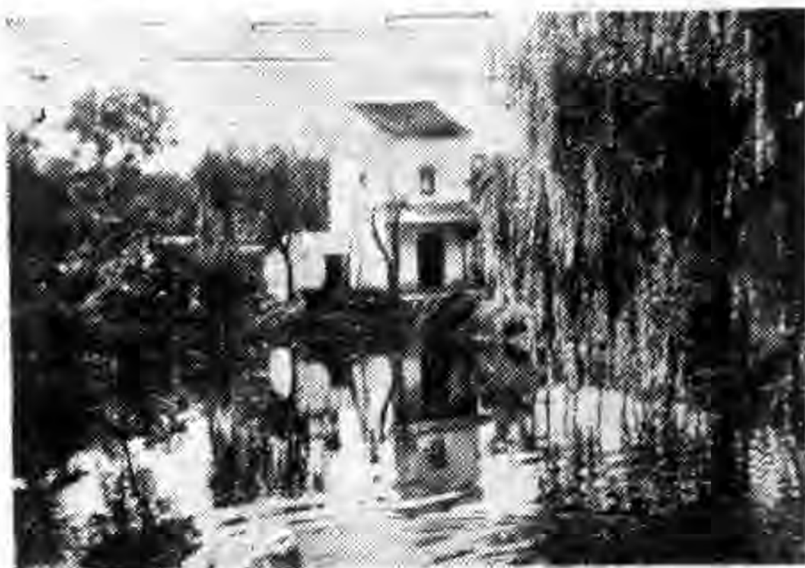
沈 涵 虛 孫 中 大 農 場 風 景 之 一

學生，其性質完全與其他國家的學生不同，他們對於國內的政治，常常抱着熱心的注意。一方面，學校當局，對於國家生存之自