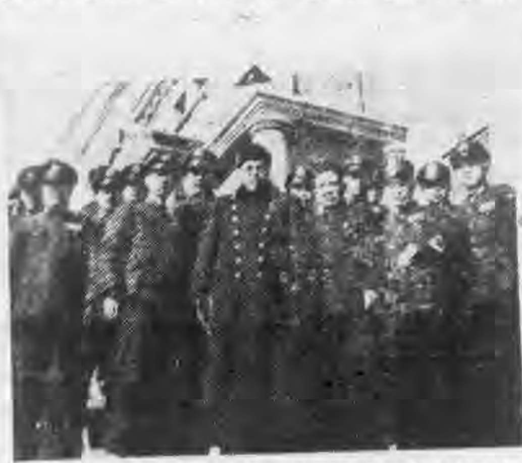
(贈岑小)氏張即者△有影留前發出長段張

四月上旬奸匪渤海軍區仇鴻印部發動了一次攻勢，幸未得逞，由於援軍迅速到達立即解圍，