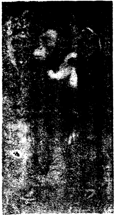
(第5圖) 猩猩站直了身子。

因此，沒有思維，沒有社會，就不可能有語言。但是什麼東西逼使人團結在社會裏，替自己締造出思維和它的逃避不了的旅伴——人類語言呢？爭取人類解放的