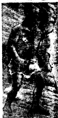
(第 10 圖) 古代人 (假定像)