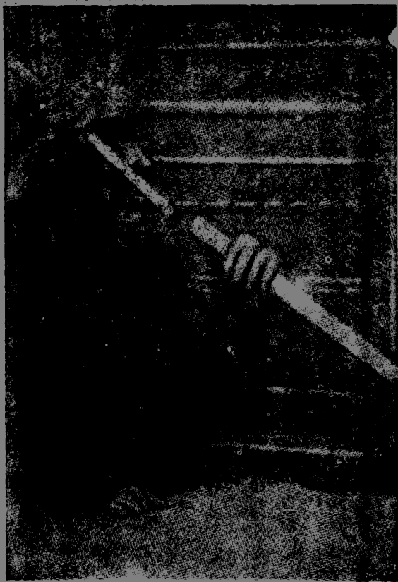
(第 8 圖) 猿把兩根棒接起來。