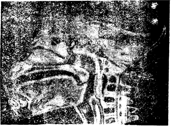
(第7圖) 小猩猩的發音器官。

緒。沒有一種動物能夠互相詢問和回答問題。由於沒有連貫的意思和相互的談話，所以牠們也就沒有真正人類的語言。