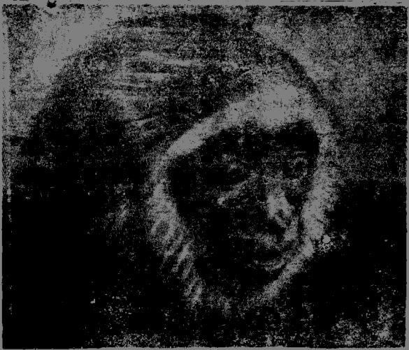
(第2圖) 類人猿的驚奇表情。

葉爾克斯的兩隻人猿一樣，發出了二十三種不同的聲音，並且，也像漢納的研究結果一樣，牠搖頭就是表示否定。