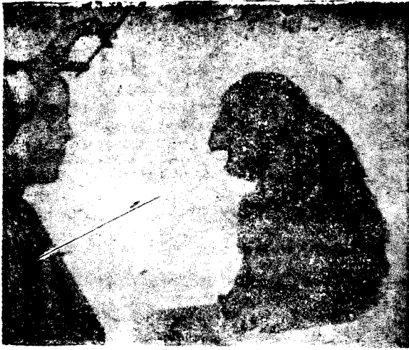
(第1圖) 一隻小猿在鏡子裏看見了自己。

雖然這一材料並不能證明猿能說話，但是我們却可以根據這材料來做另一個重要的結論。猿下巴（下顎的突出部）的缺乏毫不妨礙牠發出許多子音和母音，雖然下巴的缺乏常常被人作為不能藉舌頭之助而發出某些聲音的證據。