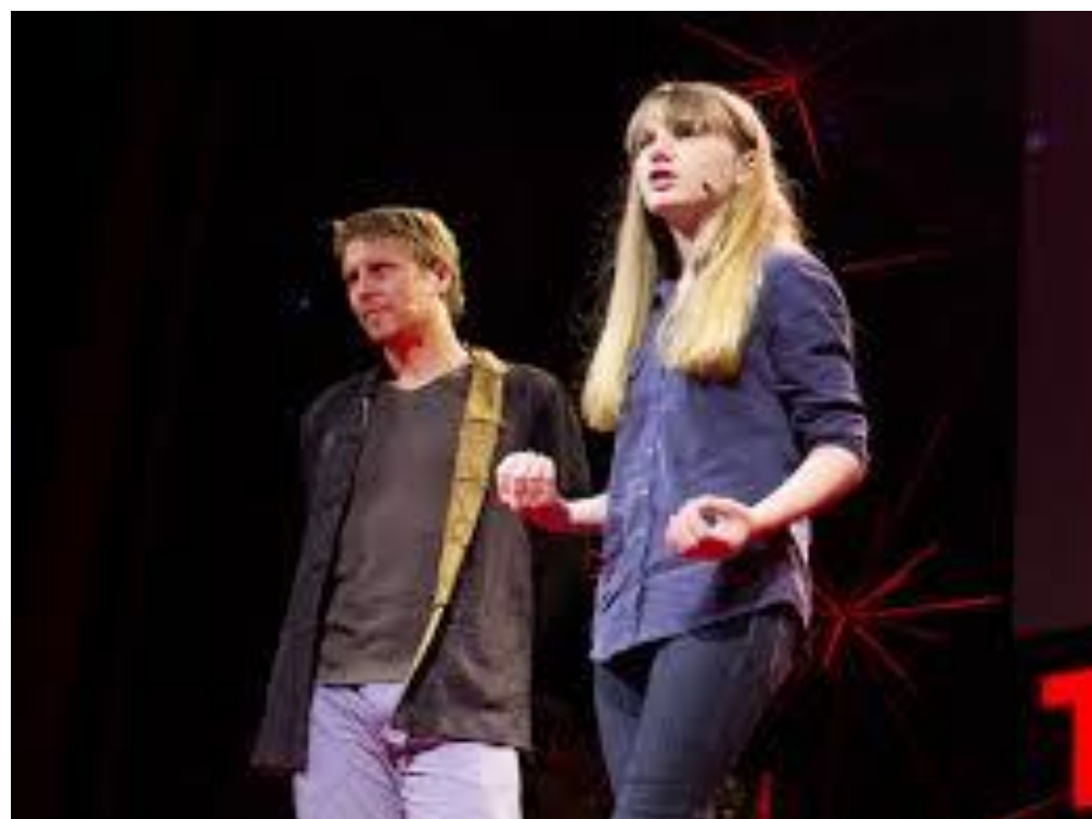
Beau Lotto + Amy O'Toole | TEDGlobal 2012

Beau Lotto + Amy O'Toole: A ciência é para todos, inclusive para crianças.