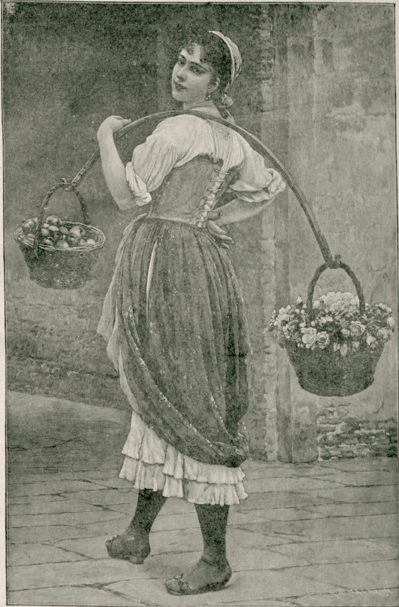
صنایع نفیسه‌دن نابلو : چیچکلر ، میشلر !

برینک عناصر اصلیه‌سنی تنوع ایله وحدتک امتزاجنده کورور .