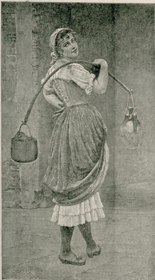
[ ینه اورفتار ]

بشیره دن مستقله ؛ اوچنجیسی پرنوع حسن که بردرجه به قدر کیفیدر . ب . آندره به کوره اساس حسن ، انتظام در . حسن اصلی : انتظام هندسیدرکه اشکاک تناسب وانتظامنده تجلی ایدر ؛ حسن طبیعی : جناب خالک تأسیس ابتدیی وجهله موجود قوانین طبیعی دن انبعاث ایلر . اوچنجی نوع حسن ایسه یالکز وجود بشرده بولونوب بونک سبی موجودیت روحکده انتظامه انضمام ایدیشیدر .