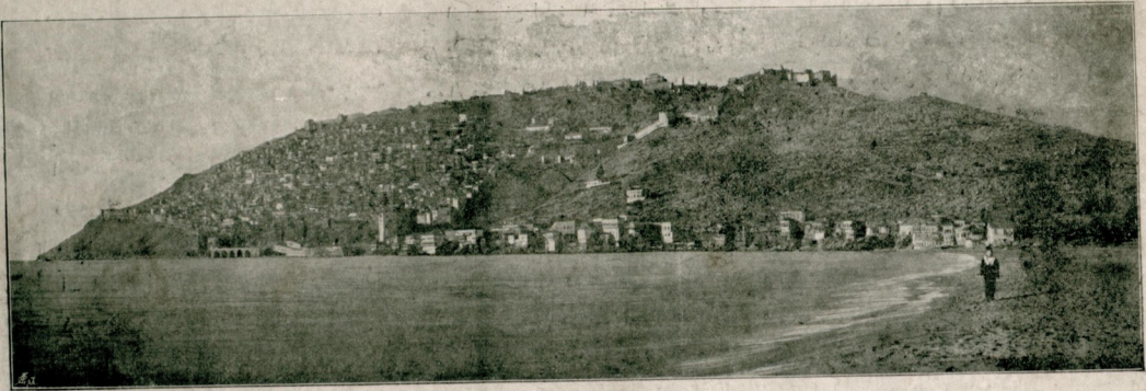
[ قائمقام عزتو خلیل کامل بکاک اومو غرافیسندن ]