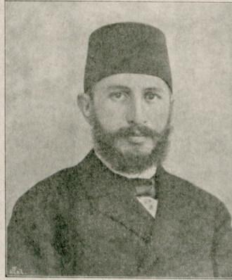
نیکده متصرفی سعادتلو غالب بك افندی حضرتاری S. E. Galib Bey, gouverneur de Nidé.

بر تقيیدن ، مسكناری حقير كبله لردن ، فقهلری خرما ويا دوه سودندن عبارت اولان بو چول اولدينك ناصيه لرنده علام ابتهال و ذلت كورلز ؛ بالعكس هپسي استغنا وعفتك نمونه مجسميدر .