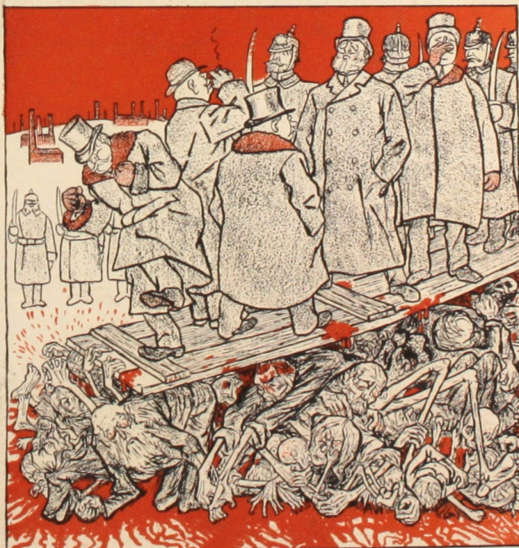
Рис. Т. Т. Гейне.

Вышли въ свѣтъ двѣ серіи открытыхъ писемъ: красочная (23 сюжета) и однотонная (20 сюжетовъ). Готовится и въ скоромъ времени выйдетъ изъ печати третья серія. Стоимость открытыхъ писемъ въ розничной продажѣ: красочн. — 10 коп., однотон. — 8 коп. Торговцамъ и оптовщикамъ дѣлается обычная скидка. Со склада открытыя письма продаются въ количествѣ не менѣе 200 штукъ. На комиссію изданія не отпускаются.