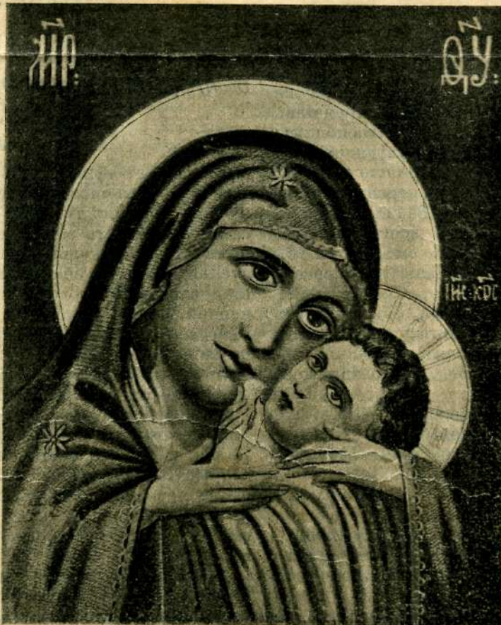
Корсунская икона Божіей Матери, находящаяся въ Нашинскомъ Успенскомъ соборѣ.

Прими, Всеблагоспособная Пречистая Госпоже Владычице Богородительнице, сія честныя дары отъ насъ, недостойныхъ рабовъ Твоихъ, къ Твоему цѣльбоносному образу пѣніе возсылающихъ со умиленіемъ, яко Тебѣ Самой сущей ту и послушающей моленія наша и подающей съ вѣрою просящимъ по коемуждо прошенію и исполненіе: скорбящимъ скорби облегчаеши, немощнымъ здравіе даруеши, разслабленныхъ и недужныхъ исцѣляеши и отъ бѣсныхъ бѣсъ прогоняеши, обидимыя отъ обидъ избавляеши и насилуемыхъ спасаеши, грѣшныхъ прощаеши, прокаженныхъ очищаеши и малыхъ дѣтей милуеши, и неплодныя отъ