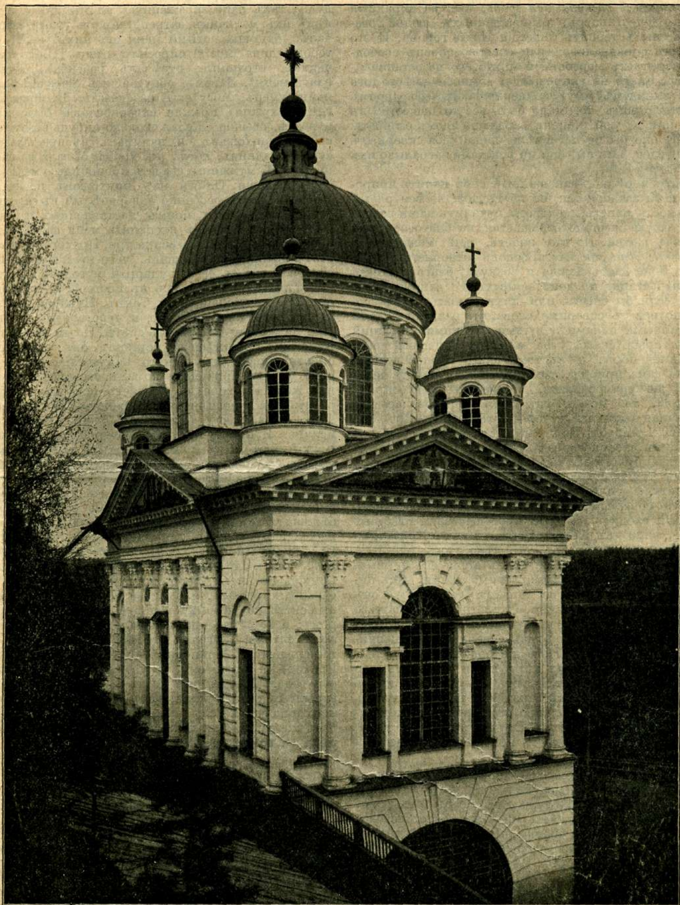
Внѣшній видъ храма Св. Іоанна Предтечи, въ Саровской пустыни. (Къ 10-ти лѣтню открытія мощей преп. Серафима).