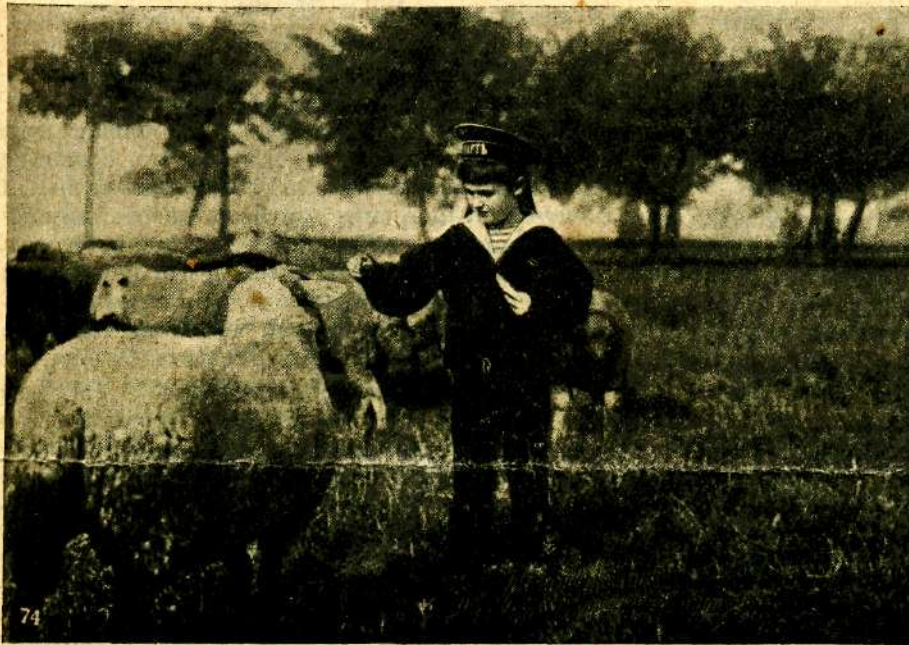
Его Императорское Высочество Наслѣдникъ Цесаревичъ Алексій Николаевичъ кормить барашковъ.

Единственно вѣрнымъ и несомнѣнно божественнымъ сновидѣніемъ по словамъ св. отцовъ, можетъ быть только то, въ которомъ бываетъ изображеніе креста Христова. Святого креста дьяволъ показывать не можетъ, такъ какъ не находитъ средствъ изобразить его какъ либо иначе, тѣмъ болѣе, что мы хорошо знаемъ крестное знаменіе. Дьяволъ даже не смѣетъ и употребить его. Онъ боится и трепещетъ креста; потому что на крестѣ разрушена сила его и крестомъ нанесена ему смертельная рана. (См. Руков. къ дух. жизни св. отцовъ Варсан. и Іоанна отв. 413). Къ такого рода сновидѣніямъ относится и то, о которомъ я сейчасъ хочу разсказать.